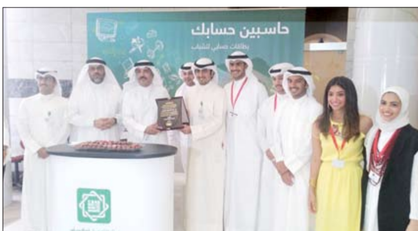
جناح البنك التجاري