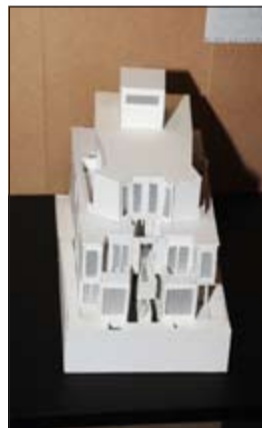
جانب من أعمال الطلبة