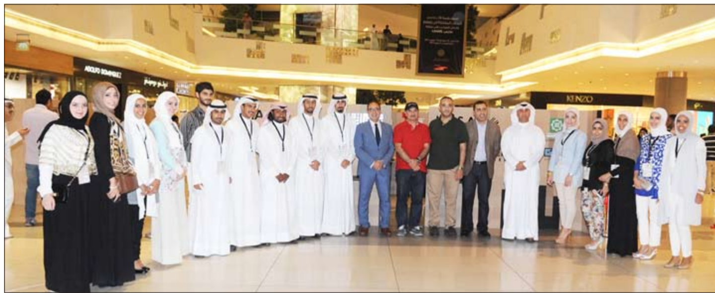
المشاركين في المعرض