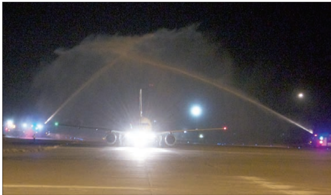
لحظة وصول طائرة طيران الجزيرة إلى مطار الكويت الدولي والاحتفال بها