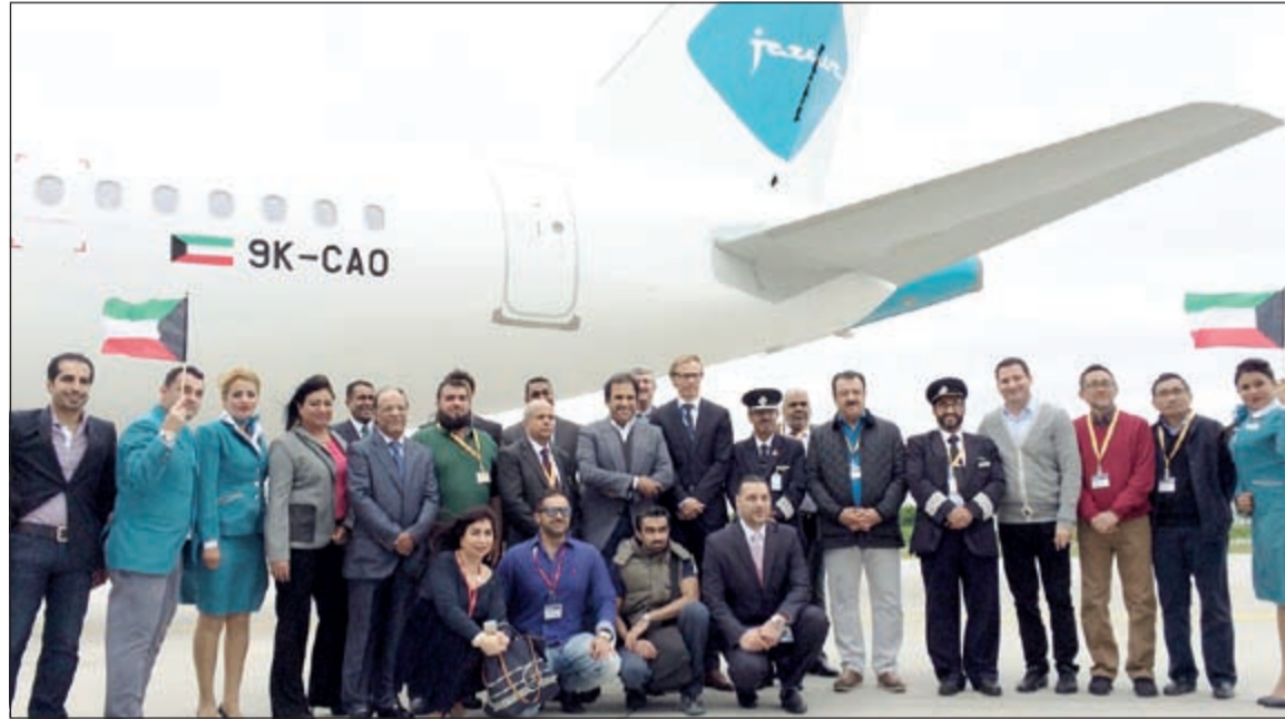
بودي يتوسط فريق عمل الجزيرة والوفد الكويتي الإعلامي عقب تسلم الطائرة من مصنع إيرباص في هامبورغ الألمانية