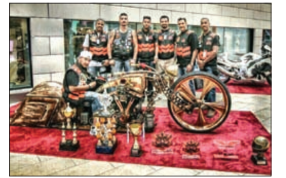
أبطال الكويت للدراجات النارية المعدلة

لاستعراض مهارات وتطلعات الشباب في مختلف مناطق العالم.» وقال المدير العام والرئيس التنفيذي لـ Ooredoo في الكويت م. عبدالعزيز فخرو: «نحن متحمسون لهذه الحملة لأنها تحقق تطلعاتنا شريحة كبيرة ومهمة في المجتمع وهي شريحة الشباب. نتطلع فعلاً لإلهامهم وتشجيعهم على ممارسة ما يحبونه من نشاطات خصوصاً بمشاركة سفير علامتنا التجارية المحبوب نجم كرة القدم ليو ميسي.» وقال ليونيل ميسي بهذه المناسبة: «أنا مسرور للغاية للمشاركة مع Ooredoo، في هذه الحملة، والتي تهدف من خلالها للوصول إلى المواهب الشابة في كرة القدم في مختلف بقاع العالم، وتشجيعهم على «إطلاق قدراتهم» وأمل أن نتمكن من مساعدة المشاركين على الاستفادة من التدريبات وإثراء مشاعرهم ليصبحوا هم الجيل القادم من نجوم كرة القدم.» ويظهر الإعلان بطل كرة القدم أثناء استعراض مهاراته في هذه اللعبة مع فريق من اللاعبين الشباب في قلب مدينة كبرى، ويثري الإعلان لفئة لتقنية Ooredoo. إن أحد أهداف الحملة «أطلق قدراتك» هو إظهار الروابط بين علامة Ooredoo التجارية والدور المهم الذي يقوم به ميسي في بطولات كرة القدم الدولية مثل بطولة كأس العالم، البطولة التي تشهد أكبر إقبال جماهيري من شتى أنحاء العالم. ومن الأسباب الأخرى التي تم إطلاق الحملة من أجلها إبراز جهود Ooredoo في إثراء حياة عملائها ومجتمعاتهم، وذلك من خلال توحيد الجماهير عبر حبها لكرة القدم والمساعدة في دعم