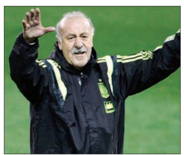
فيسنتي دل بوسكي

أعرب مدرب المنتخب الإسباني فيسنتي دل بوسكي عن تفاؤله بإمكانية تعافي ديفيو كوستا وخيسوس نافاس في الوقت المناسب قبل إعلان التشكيلة النهائية للمشاركة في مونديال البرازيل 2014. وأشار دل بوسكي إلى أن حظوظ مشاركة اللاعبين في نهائيات البرازيل جيدة، مضيفاً «سيخضع الثنائي للفحوصات. ديفيو سيخضع لفحص الأشعة، أما خيسوس فيبدو في وضع جيد». وواصل دل بوسكي الذي يتوجه لإعلان تشكيلته النهائية اليوم: «سنقوم بتقييم وضعهما على أن نتخذ القرار صباح اليوم.» وكان كوستا (25 عاماً) ترك أرضية الملعب بعد 9 دقائق على انطلاق مباراة اتلتيكو وجاره اللدود ريال مدريد السبت الماضي في