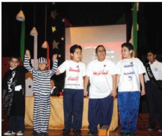
مشهد من محاكمة الصف