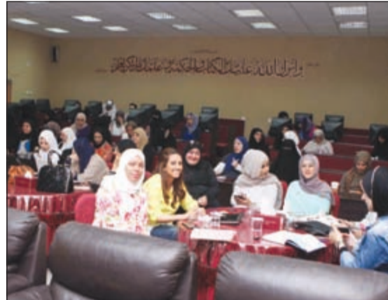
جانب من الحضور أثناء اللقاء