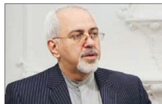
محمد جواد ظريف

وأضاف أنه سعيد ومتفائل بهذه الزيارة قائلا: «أرى أن هذه الزيارة ستكون فضلا جديدا في علاقات هاتين الدولتين الجارتين اللتين طالما كانتا قريبتين من بعضهما بعضا».