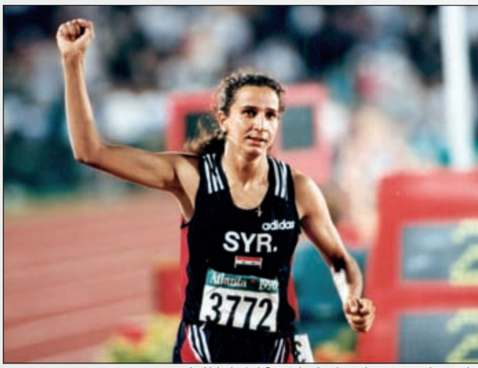
غادة شعاع ترفع يدها بعد احرازها ذهبية اولمبياد اتلانتا

غادة شعاع.. اسم كبير في عالم الرياضة العربية ولا يحتاج الى المقدمات الطويلة للتعريف به، وكان «شعاع» غادة قد أثار طريق الرياضة العربية في اولمبياد اتلانتا 1996، حينما انتزعت بنت سورية ذهبية منافسات السباعي من بطلات العالم الأميركيات والألمانيات وهن صاحبات التخصص في هذه المنافسة. قصة نجاح البطلة الأولمبية غادة تحتاج للكثير من الكتب والمجلدات للحديث عنها على الرغم من الصعوبات والأوضاع الرياضية العربية غير الجيدة والتي لا تشجع على احتراف الرياضة ومقارعة العمالة من أجل المنافسة وتحقيق المجد للدولة. وحلت غادة ضيفة كبيرة على «الأنباء» التي فتحت قلبها لها وأجابت بكل شفافية عن الكثير من المواضيع، كما وجهت العديد من سهام الانتقاد نحو المسؤولين على الرياضة في مختلف الدول العربية وطلبتهم بالعمل لنقل الأبطال العرب نحو العالمية والمنافسة في الدورات الأولمبية التي باتت تعكس التطور الحقيقي في أي بلد، وفيما يلي نص الحوار: