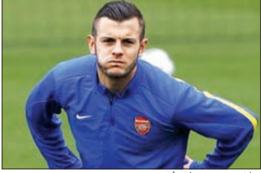
ويلشير يمتدح معلمه فينغر

قال جاك ويلشير لاعب وسط إنجلترا إن آرسنل فينغر مدرب ناديه آرسنل أقنعه بعدم التعجل في العودة من الإصابة ليكون لائقا للعب في كأس العالم.