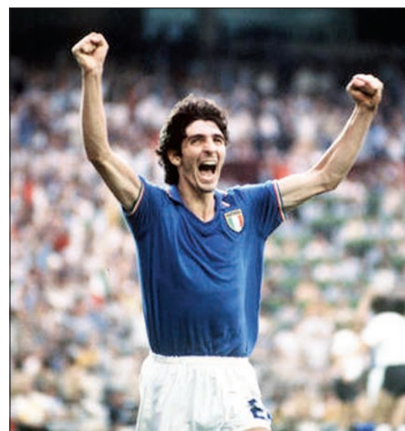
روسى الرجل المنبوذ في البرازيل

إلى صناديق التقاعد. وكانت النتيجة أن فازت فرنسا 1-0 بهدف تييري هنري إثر تمريرة حاسمة من «زيزو»، الذي خاض بالمناسبة إحدى أفضل المباريات في مسيرته الاحترافية. وكتب حينها أحد المعلقين الرياضيين الأكثر احتراما في البرازيل جوسكا كفوري غداة الخسارة: «أعتبر نفسي سعيدا لكوني أحد الشهود في الملعب