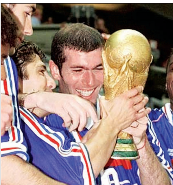
زيدان يحمل كأس العالم

على أحد أفضل العروض الفردية في التاريخ للاعب عبقرى» اسمه زيدان. زيداني الملقب بـ «الساحر» بيليه ورونالدو وروبرتو كارلوس والبرازيل بأكملها لم تبخل بالإشادة بزيدان وفي حديث للفيفا، أعرب زيدان عن تأثره بمدح زغالو (بطل العالم كلاعب ومدرب مع