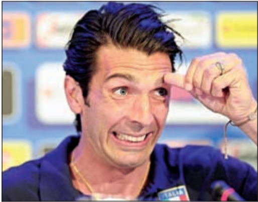
بوفون حامي عرين المنتخب الإيطالي

قال جيانلويجي بوفون حارس مرمى إيطاليا إن منتخب بلاده جدير بالثقة ويعرف قدراته جيدا وينبغي عليه على الأقل بلوغ دور الثمانية في نهائيات كأس العالم.