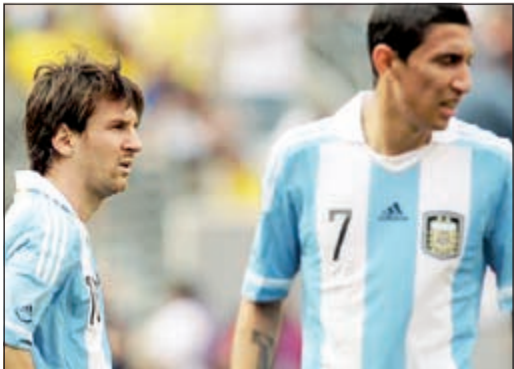
العالم يتربص الثنائي ميسي ودي ماريا

واصل اللاعب الدولي الأرجنتيني أنخيل دي ماريا لاعب نادي ريال مدريد الإسباني دعمه وإشادته بزميله في التانغو ليونيل ميسي نجم الفريق الكاتالوني برشلونة وذلك خلال تجمعهما قبل انطلاق بطولة كأس العالم.