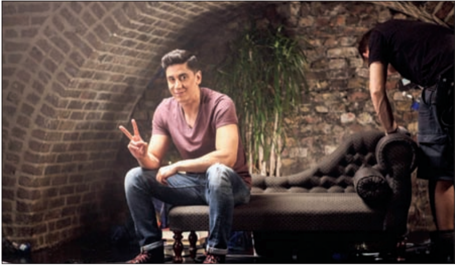
..وفي مشهد من الكليب