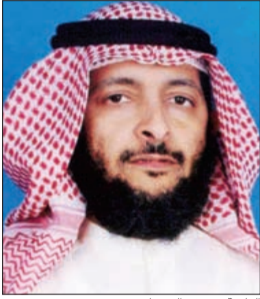
الداعية يوسف السويلم