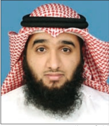
الداعية حسين المعيوف