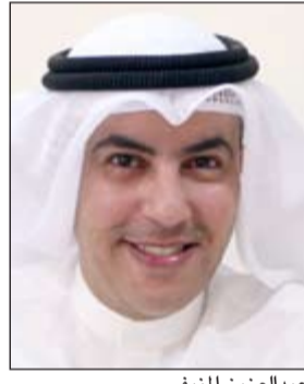
عبد العزيز المنيفي

للتأكيد على التطور والتقدم الكامل والشامل. وأضاف أن سبب المشكلة أن كل شخص يبحث عن مصالحه الشخصية بعيداً عن المصلحة العامة حاناً الجميع على العمل على الدفع بعجلة التنمية وذلك بالإصلاح الشامل، مبيناً أنه لا تتساقط على رأي واحد يخدم الوطن، مضيفاً أن المواطن كان هو الخاسر الوحيد جراء هذا التشاحن الذي تعيشه البلاد منذ سنوات.