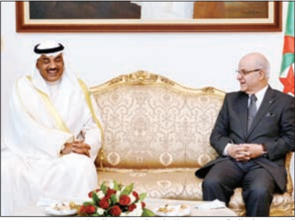
الشيخ صباح الخالد مع رئيس المجلس الدستوري الجزائري