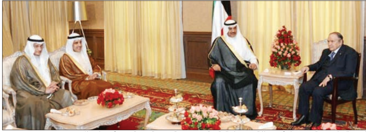
الرئيس الجزائري عبدالعزيز بوتفليقة مستقبلا الشيخ صباح الخالد والسفير سعود الدويش والسفير الشيخ د. أحمد ناصر المحمد