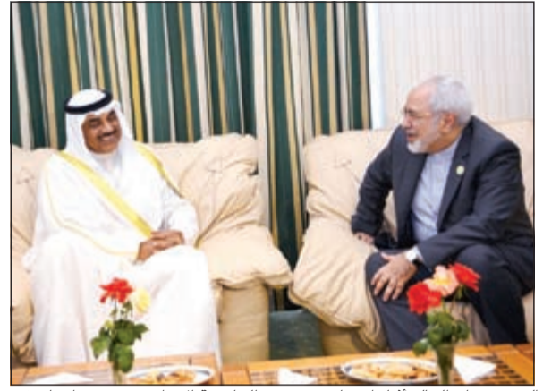
الشيخ صباح الخالد أثناء اجتماعه مع وزير الخارجية الإيراني محمد جواد ظريف