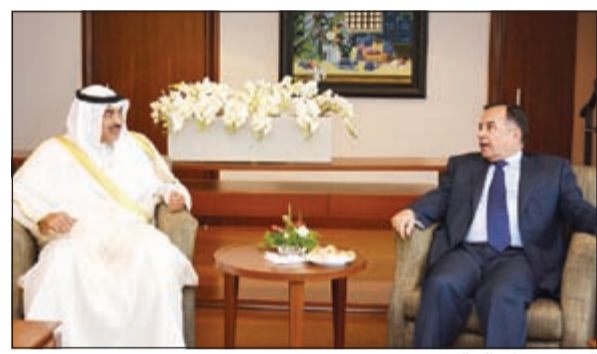
الشيخ صباح الخالد ود. نبيل فهمي

من جهته، أشاد الرئيس بوتفليقة بعمق العلاقات الأخوية بين البلدين والشعبين الشقيقين وبسياسة الكويت الحكيمة والمتوازنة على الصعيدين الإقليمي والدولي. وضم الوفد المرافق سفيرا في الجزائر سعود الدويش ومدير إدارة مكتب النائب الأول لرئيس مجلس الوزراء ووزير الخارجية السفير الشيخ د. أحمد ناصر المحمد. إلى ذلك، اجتمع النائب