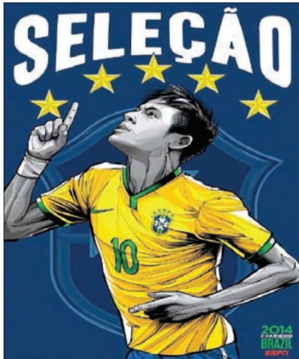
نيمار والنجمة السادسة

بنزيمه وبلال ريبيري لفرنسا، ومسعود أوزيل وقليب لام وشافينيشتايفر لألمانيا، وبرنس بوتانغ ومايكل اسيان وكوت ديفوار، وهوندا وشينغي كاغاوا لليابان.