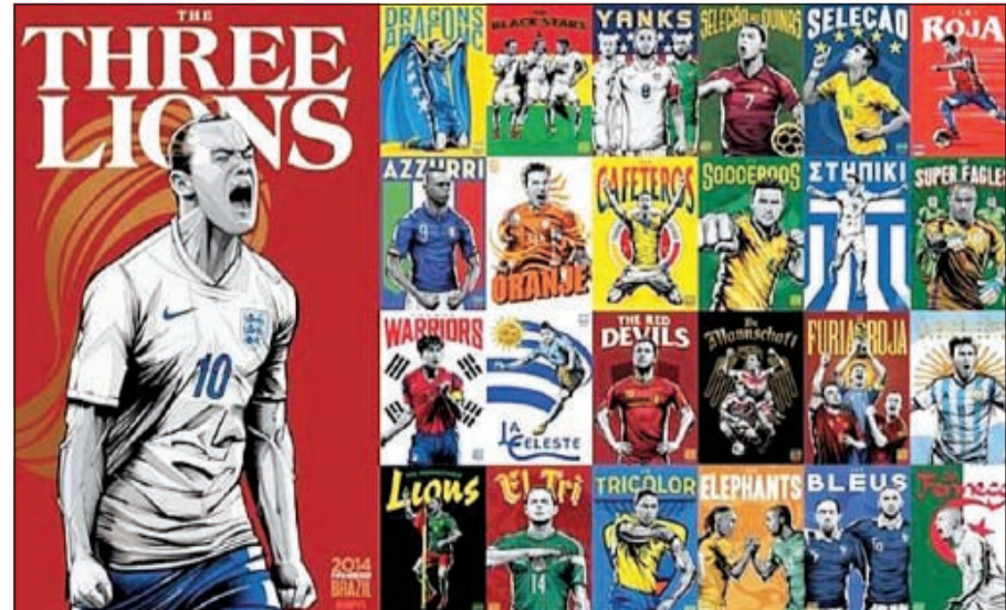
ملصقات خاصة لنجوم المونديال

ألقت صحيفة «ديلي ميل» الإنجليزية الضوء على الفنان البرازيلي كريستيانو سيكويرا الذي تولى مهمة تصميم ملصقات لجميع المنتخبات المشاركة في كأس العالم. وتمكن الفنان البرازيلي من إضفاء صبغة خاصة على كل ملصق بإبراز لقب الفريق ونجمه الأبرز حيث ظهرت هذه الملصقات بشكل فني أكثر من رائع وغير معتاد. وشهدت هذه الملصقات العديد من النجوم المشاركة في هذا المحفل العالمي وكان أبرز الظهور لوايين روني نجما للمنتخب الإنجليزي وفان بيرسي نجما للمنتخب الهولندي وادين دجيكو نجما لمنتخب البوسنة. كما ظهر القائد إيكر كاسياس وتشافي وانيستا لاسبانيا وكريستيانو للبرتغال وليونيل ميسي للارجنتين ونيمار للبرازيل، وهازارد بلجيكا، ولسوكا مودريتش