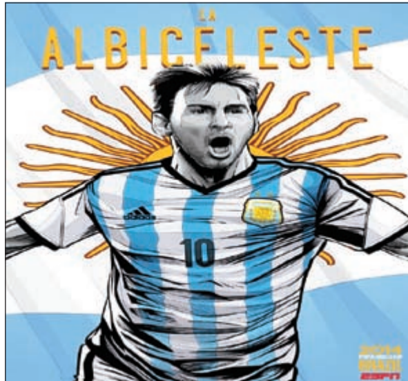
ميسي أمل التانغو

بنزيمه وبلال ريبيري لفرنسا، ومسعود أوزيل وقليب لام وشافينيشتايفر لألمانيا، وبرنس بوتانغ ومايكل اسيان وكوت ديفوار، وهوندا وشينغي كاغاوا لليابان.