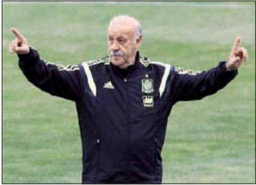
دل بوسكي يعطي توجيهاته للاعبين

أكد فيسنتي دل بوسكي المدير الفني للمنتخب الإسباني أن لاعبيه تغيروا نتيجة الألقاب العديدة التي حصدها، مؤكدا على ضرورة عدم الاعتقاد أن الفوز بالنسخة الماضية من المونديال ستسهل مهمتهم في رحلة الدفاع عن اللقب في البرازيل، وذلك في مقابلة مع موقع الاتحاد الدولي لكرة القدم (فيفا). وقال دل بوسكي، في المقابلة التي أجراها معه نظراؤه في المنتخب البرتغالي باولو بينتو والولايات المتحدة يورغن كليمنسمان واليابان البيرتو زاكيروني ولاعباه سيرخيو راموس وتشافي هرنانديز، «دورنا هو تحذيرهم من الخطر المحقق بنا».