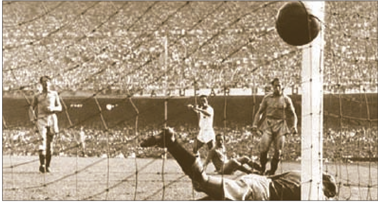
أدمير يدمر السويد

وقابل منتخب إسبانيا نظيره الدنماركي في دور الـ 16 في مونديال 1986 بالمكسيك، استطاع الماتادور الإسباني تحقيق الفوز بنتيجة 5-1 منها سوبر هاتريك ليوتراغينيو في الدقائق 43، 56، 80، 86.