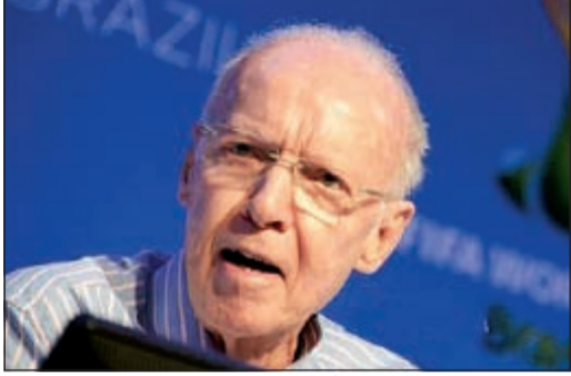
اسطورة البرازيل يعاني من آلام شديدة في الظهر

نكرت الصحف البرازيلية أن اسطورة كرة القدم البرازيلي ماريو زاغالو (82 عاما) نقل إلى المستشفى في ريو دي جانيرو اثر معاناته من التهاب في العمود الفقري. ويعاني زاغالو الفائز 4 مرات بكأس العالم (عامي 1958 و1962 كلاعب و عام 1970 كمدرّب و عام 1994 كمساعد للمدرّب) منذ نحو 20 يوما من التهابات في العمود الفقري اثرت على قدرته على الحركة. وأوضح ابنه ماريو زاغالو جونيور لوسائل الإعلام: «لا يستطيع الوالد إجراء الفحوصات في المنزل فتوجب نقله إلى المستشفى لإتمام العلاج بواسطة الأوردة، وكل شيء تحت السيطرة، إلا أن هناك احتياطات إضافية تم أخذها بعين الاعتبار بسبب تقدمه في السن». وأكد زاغالو الابن: «إن والده سيبقى في المستشفى حتى الاثنى المقبل، من دون أن يشير إلى إمكانية حضوره مباريات منتخب بلاده في مونديال 2014 حيث تلقى دعوة من الاتحاد البرازيلي لحضورها جميعها.