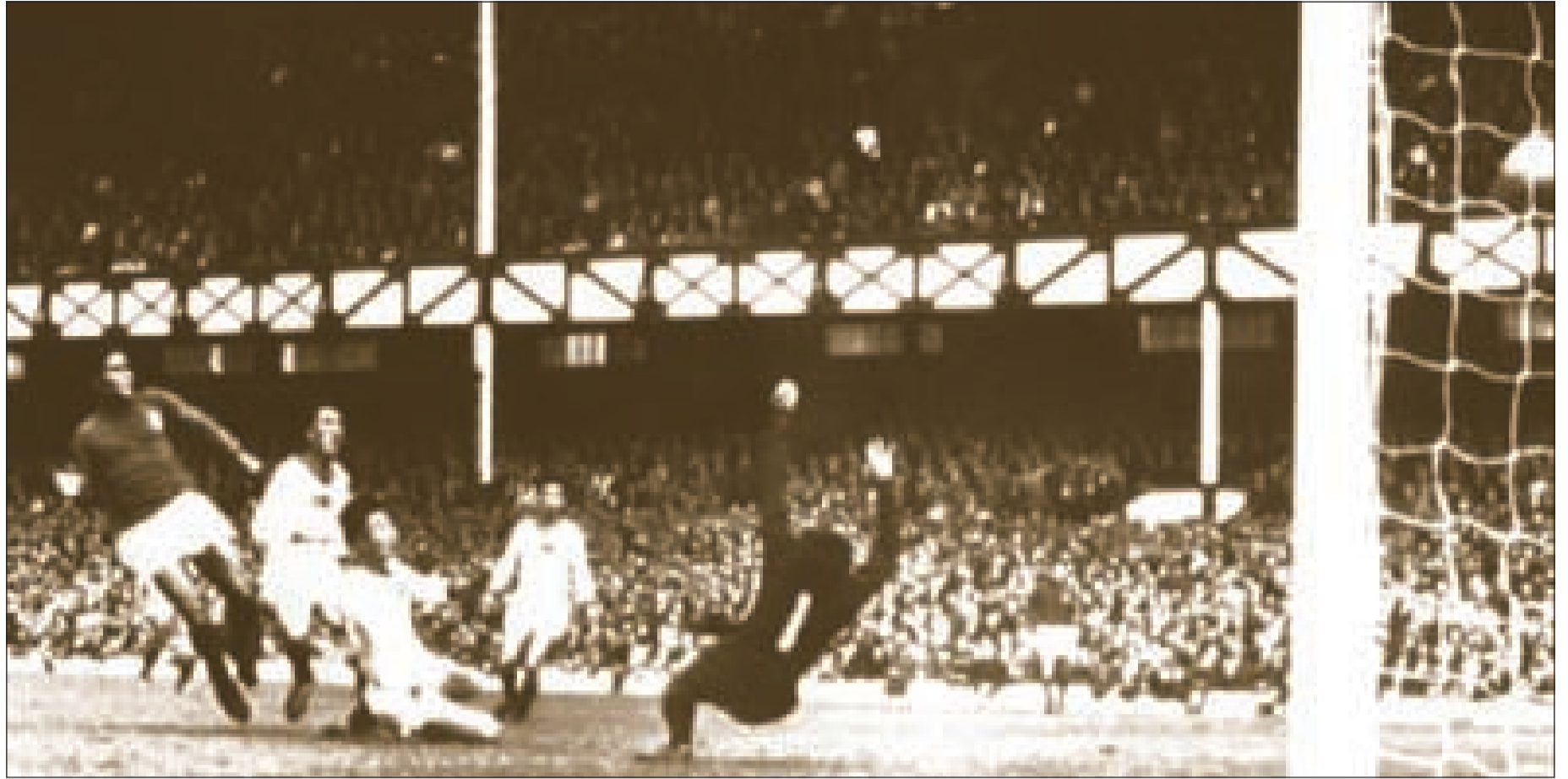
اوزيبيو يفترس كوريا الشمالية

وأوضح دل بوسكي شعوره بـ «المسؤولية» إزاء المونديال بعد الفوز باللقب بالنسخة الماضية، وبطولة كأس أوروبا 2012، مشيرا إلى أن منتخب بلاده يسعى لخوض احتفالية كروية والاستمتاع بالتحدي الذي سيواجهونه في المونديال.