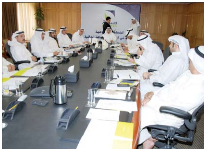
جانب من الجمعية العمومية أمس