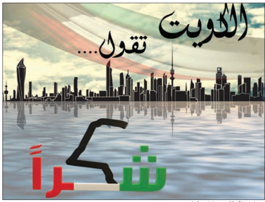
شعار حملة «الكويت تقول شكراً»