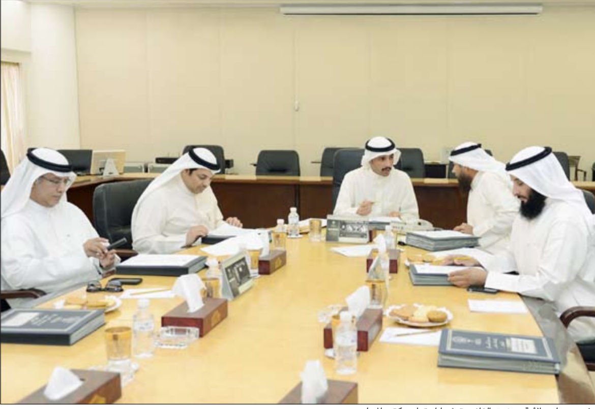
رئيس مجلس الأمة مرزوق الغانم مترشدا اجتماع مكتب المجلس

مواعيد الزيارات لاحقا، علاوة على توجيه دعوات الى رؤساء برلمانات شقيقة وصديقة لزيارة مجلس الأمة خلال المرحلة المقبلة. وأضاف الصانع ان مكتب المجلس اطلع على بعض الامور الادارية المتعلقة بالامانة العامة واتخذ القرارات المناسبة بشأنها. من جانب آخر، بحث رئيس مجلس الأمة مرزوق علي