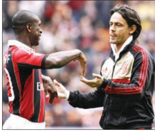
سيدورف يسلم دفة القيادة لإينزاغي

سيقتولى مهاجم منتخب إيطاليا السابق فيليبو إينزاغي تدريب ميلان بدلا من الهولندي كلارينس سيدورف حسبما ذكرت وسائل الإعلام الإيطالية أمس. وتحذرت الصحف عن ان اعلان التعاقد مع إينزاغي قد يحتاج إلى بضعة أيام لمعالجة عقد سيدورف.