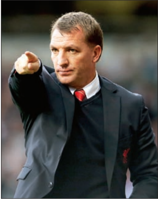
ليفربول يكافئ برندن رودجرز بتمديد عقده

مدد المدرب الإيرلندي الشمالي برندن رودجرز عقده مع ليفربول الإنجليزي، وذلك بحسب ما أعلن نادي «الحمراء» دون أن يكشف عن مدة العقد. وكان رودجرز وفي موسمته الثانية فقط مع ليفربول قاب قوسين أو أدنى من قيادة الفريق إلى اللقب المحلي للمرة الأولى منذ 1990 قبل أن يخسره في المرحلة الختامية لمصلحة مان سيتي، وكان عقد رودجرز ينتهي الصيف المقبل مع خيار تمديده لعام إضافي.