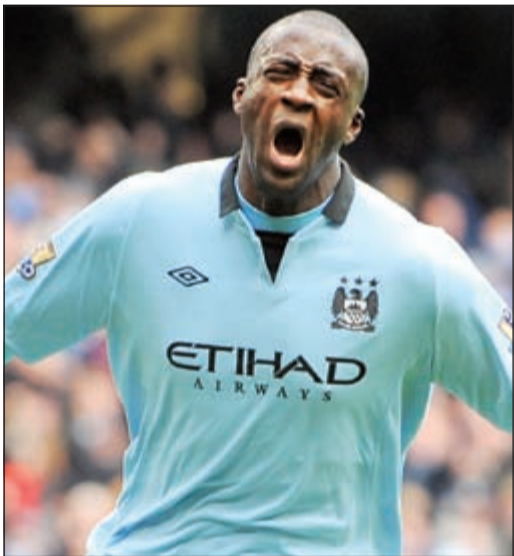
العلاقة المتوترة بين توريه وناديه قد تقوده إلى سان جرمان

صرح النجم الإيفواري يايسا توريه لاعب نادي مان سيتي الإنجليزي بأنه سيكون شرفا له أن ينضم لنادي باريس سان جيرمان الفرنسي مع تزايد الشكوك حول مستقبله في بطل الدوري الإنجليزي.