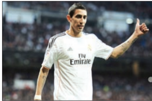
نجم نادي ريال مدريد أنخيل دي ماريا

أصبح اللاعب الأرجنتيني ونجم ريال مدريد أنخيل دي ماريا هاجسا في غرفة ملابس النادي الملكي بعد تواتر أنباء تتحدث عن إمكانية رحيله. ونشرت صحيفة «ماركا» الإسبانية الشهيرة أن اللاعب الأرجنتيني قد أصبح هدفا لكل من باريس سان جرمان وموناكو ومان يونايتد ويوفنتوس وأرسنال ومان سيتي في موسم الانتقالات القادم ليزيد سعره على 50 مليون يورو.