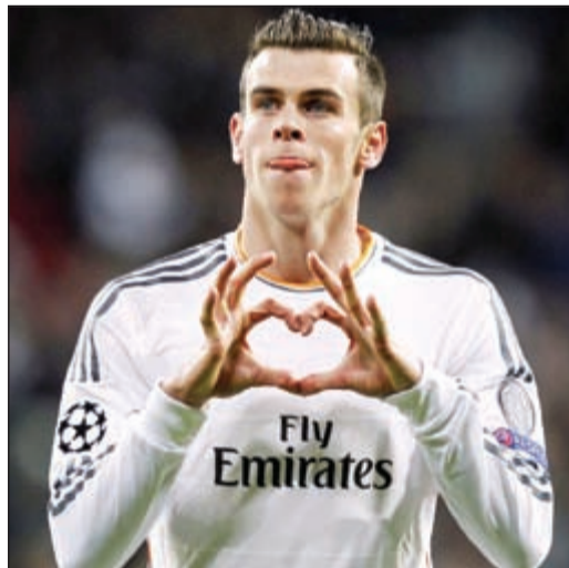
تاتو غاريت بيل ساهم في حصول ناديه السابق على أموال إضافية

يمكن لتوتنهام كسب 6,5 ملايين جنيهه استرليني من دوري أبطال أوروبا حسبما أعلنت ريال مدريد كجزء من صفقة جاريت بيل الذي انتقل إلى ريال مدريد الصيف الماضي.