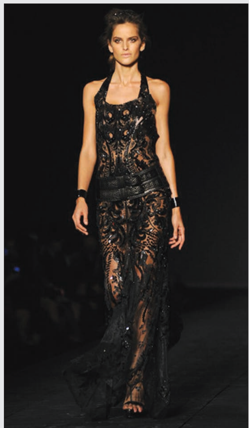
عارضة أزياء من مجموعة روبرتو كافالي

أوركاً، إحدى المجموعات الرائدة في تجارة الأزياء الرجالية وأسرعها نمواً في تركيا، كما اشترت قطر بيت الأزياء الإيطالي الشهير