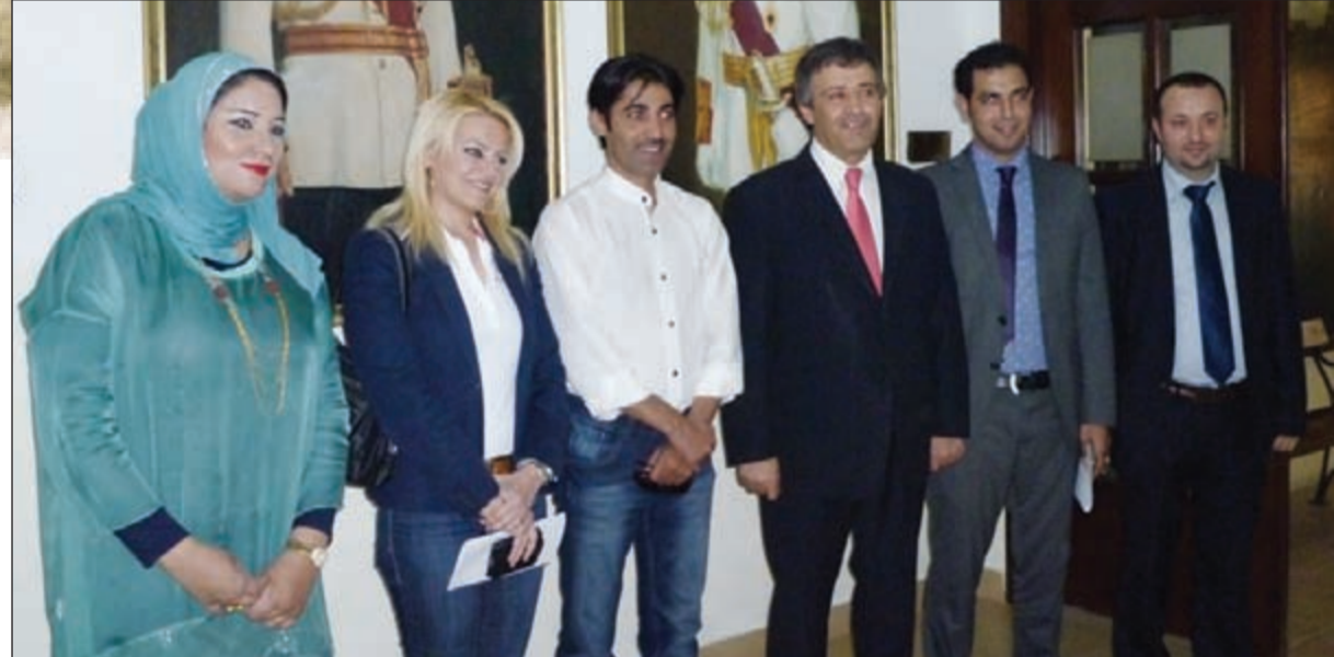
وزير السياحة الاردني د.نضال القطامين يتوسط الوفد الصحفي الكويتي