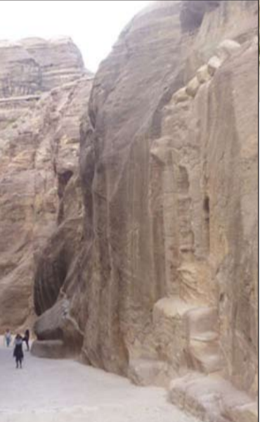
البتراء حيث عبق التاريخ وجمال الماضي

جبل نيبو: يعتبر جبل نيبو احد أكثر الأماكن المقدسة في الأردن حيث يعتقد بان النبي موسى ﷺ دفن فيه، وعند وقوفك على قمة هذا الجبل يمكنك الاستمتاع بالاطلالة الشاملة ذاتها التي شاهدها سيدنا موسى لوائي نهر الأردن والبحر الميت واريحا والقدس.