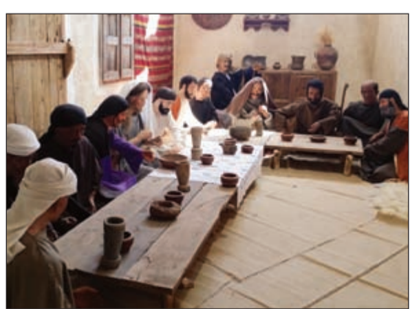
متحف الحكاية التراثية لاستوريا