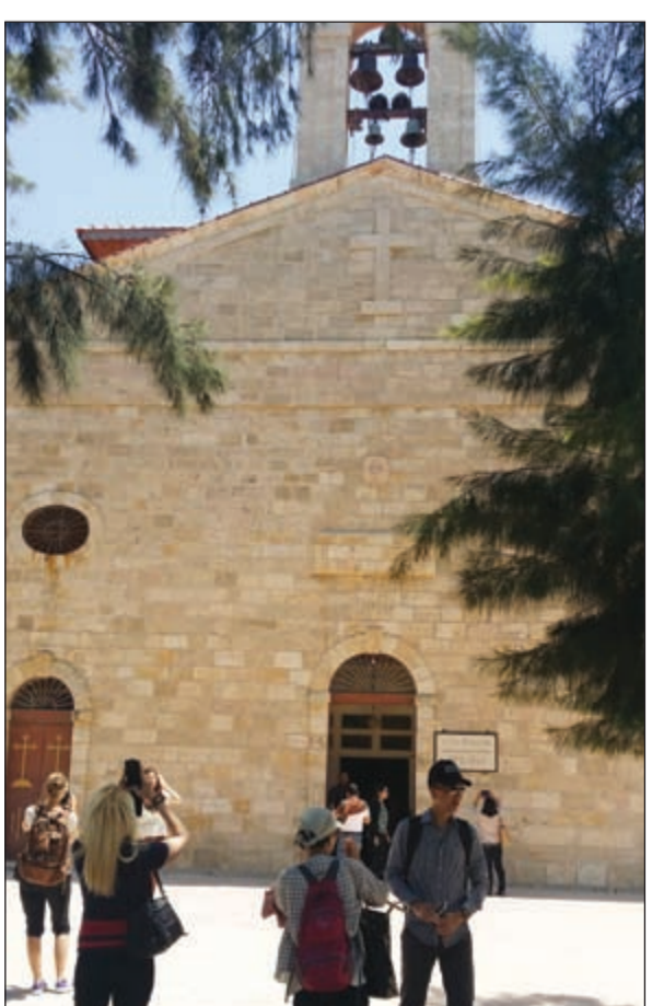
كنيسة القديس جيورجوس للروم الاورثوذكس في مادبا