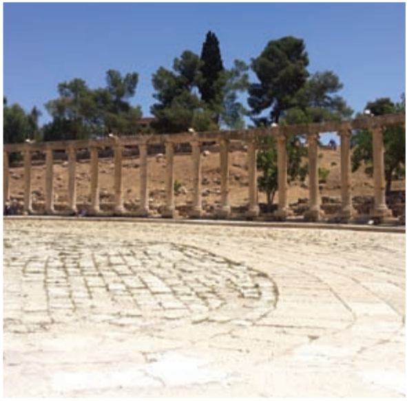
جرش مدينة المهرجانات