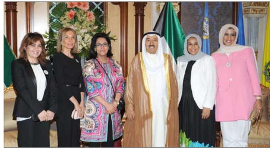
صاحب السمو الامير الشيخ صباح الاحمد مستقبلاً رئيس وأعضاء الجمعية الكويتية لاختلافات التعلم

كما رفع الى صاحب السمو الأمير الشيخ صباح الأحمد، رئيس مجلس إدارة الهيئة الخيرية الإسلامية العالمية المستشار بالديوان الأميري مبعوث الأمين العام للأمم المتحدة للشؤون الإنسانية د.عبدالله المعنوق برفقة بمناسبة انتهاء اجتماع مجلس إدارة الهيئة الـ 49 واجتماع أعضاء الجمعية العامة للهيئة الـ 14 والذين استضافتهما الكويت في الحادي والعشرين من شهر مايو الجاري، عبر فيها باسمه وباسم اخوانه أعضاء مجلس إدارة الهيئة عن أسى آيات الشكر والعرفان على دعم سموه وحفظه الله المتواصل لأنشطة الهيئة والعمل الخيري في مختلف بقاع العالم، متمنياً لسموه موفق والصحة والعافية ولدولة الكويت كل الرفعة والازدهار في ظل القيادة الحكيمة لسموه.