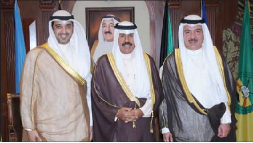
سمو ولي العهد الشيخ نواف الأحمد مستقبلاً الشيخ محمد العبدالله والمستشار صلاح المسعد

استقبل سمو ولي العهد الشيخ نواف الأحمد بقصر بيان صباح أمس النائب الأول لرئيس مجلس الوزراء ووزير الخارجية الشيخ صباح الخالد. واستقبل سمو ولي العهد بقصر بيان صباح أمس وزير الصحة د.علي العبيدي.