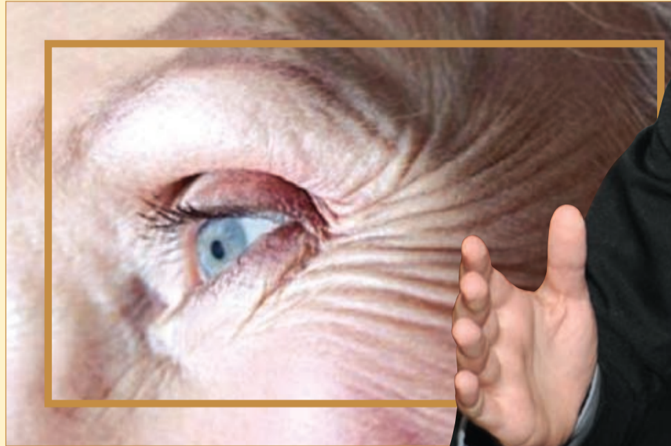
تجاعيد سن السبعين تحتاج الى الليزر

ليست للزيوت والنباتات الطبيعية فاعلية في علاج ندبات حب الشباب بل علاجه بالليزر والتقشير الكيميائي