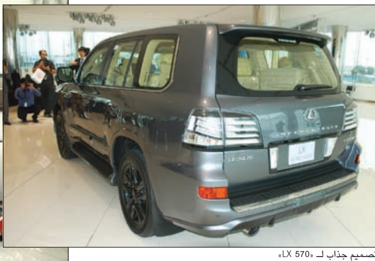
تصميم جذاب لـ LX 570