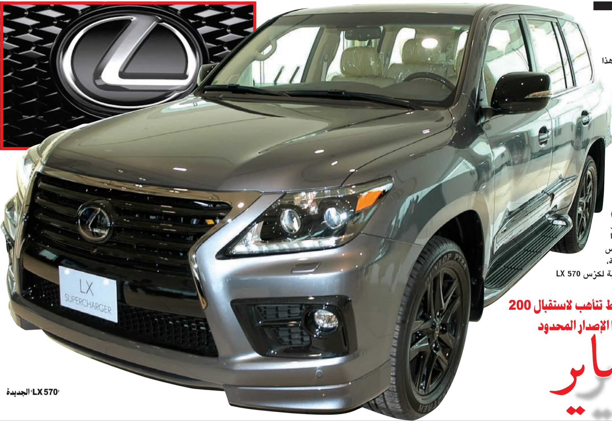
LX 570 الجديدة

تطلق «LX 570» الجديدة.. والمعززة بسوبر تشارجر