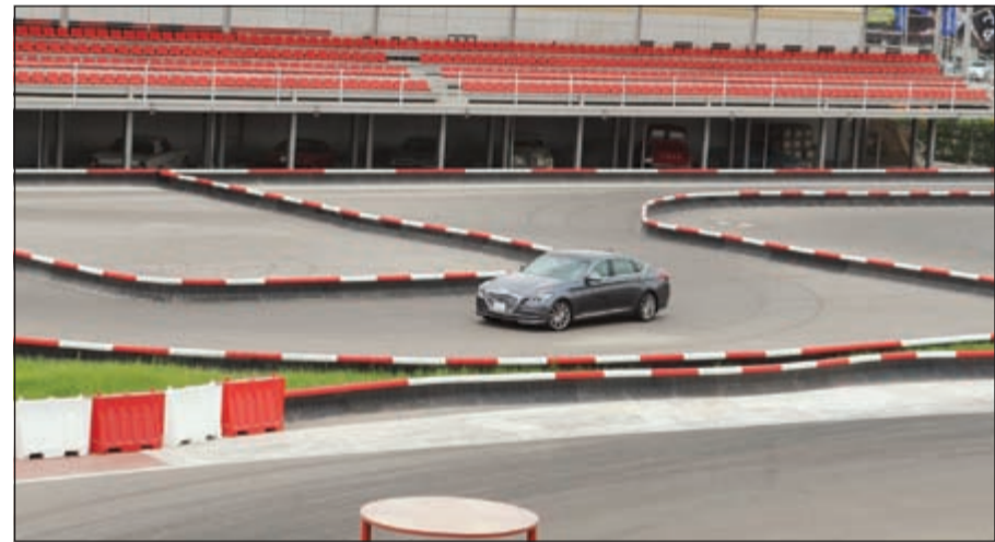
«جينيسيس» 2015.. تتحدى في حلبة «سرب»

العام 2012 بالشرق الأوسط أيضا عن سيارة «سنتينال» من محلة السيارات «سبورت أوتو» (Sport Auto) الرائدة في منطقة الشرق الأوسط. وتعتبر «سنتينال» الطراز الأزرق ضمن مجموعة سيارات هيونداي، وهي تبرز بشكل واضح التزام «هيونداي موتور» القوي بإنتاج مركبات تسهم سيارة السيدان الفاخرة في تعزيز فلسفة «الفخامة العصرية» التي تعتمدها الشركة والتي تشكل المحور الأساسي للتوجه الحديث الذي تنتهجه علامة هيونداي التجارية.