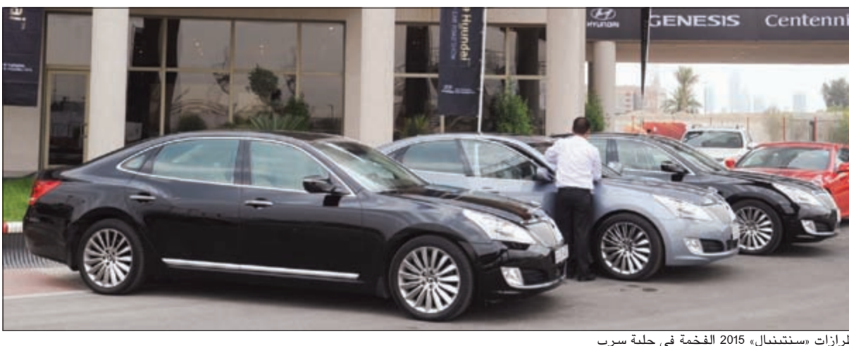
طرازات «سنتينال» 2015 الفخمة في حلبة سرب

ترجمان: «سنتينال» و«جينيسيس» تتوافر فيها كل تطبيقات الرفاهية ومعايير السلامة والراحة