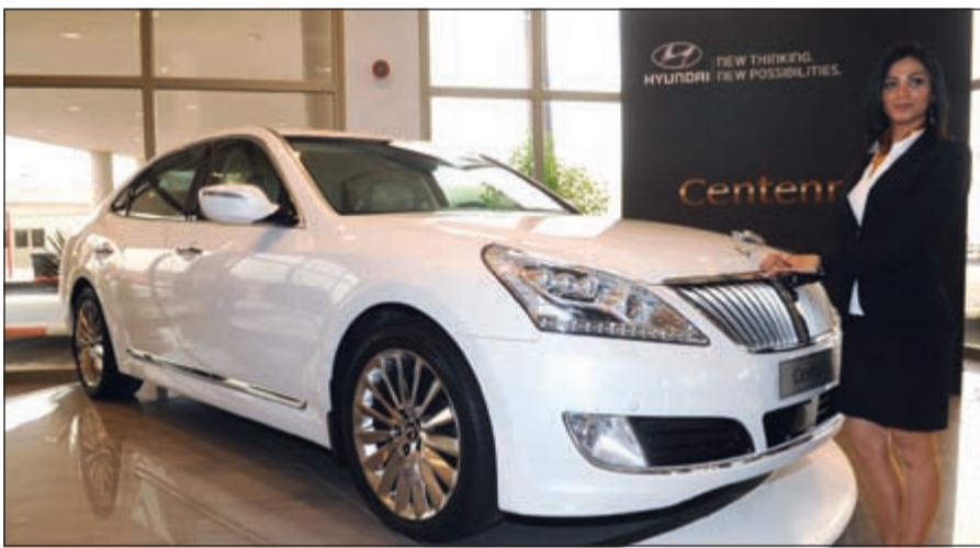
«سنتينال».. ذوق رفيع المستوى

ومما لا شك فيه أن مجموعة السيارات الفاخرة من هيونداي، والمتملة بطرازي «جينيسيس» و«سنتينال»، تشكل بحد ذاتها قصة نجاح كبيرة على مدى السنوات القليلة الماضية، ففي عام 2012 حققت مبيعات طراز «سنتينال» فترة كبيرة جدا في منطقة الشرق الأوسط بزيادة نسبتها 244٪، فيما ارتفعت مبيعات «جينيسيس» بنسبة 31٪ لتصل إلى 3,490 سيارة.