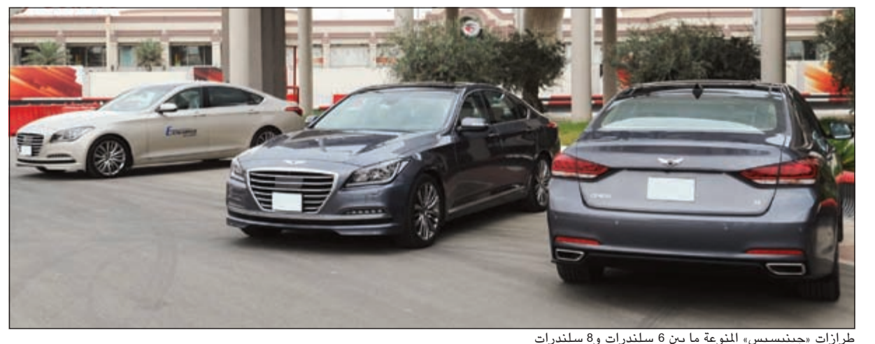
طرازات «جينيسيس» المنوعة ما بين 6 سلندرات و 8 سلندرات