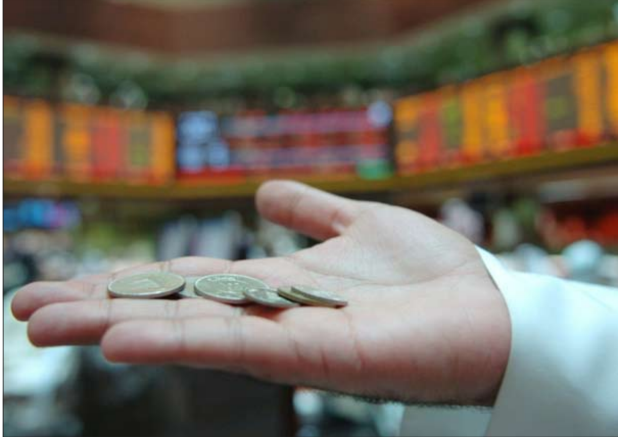
مستثمر في البورصة يعرض فلوسا في قاعة سوق الكويت للأوراق المالية في لفتة إلى حجم التداول التي لم تتجاوز أمس الـ 8,7 ملايين دينار، وهي أقل بـ 70٪ من المتوسط منذ بداية 2014

وأبوظبي وقطر كونها تنطوي على فرص استثمارية أفضل من بورصة الكويت. ● استمرار تراجع المؤشر السعري والذي قد يكسر حسب التوقعات مستوى 7000 نقطة. ● تخوف كثير من المتعاملين سواء محافظ او صناديق أو أفراد من مزيد من التراجع لبورصة الكويت خلال الفترة المقبلة في ظل عدم وجود محفزات تدفع السوق للنشاط بشكل استثماري مثل بعض أسواق المنطقة، واقتناع المحفزات على التوزيعات السنوية وإعلانات النتائج المتفرقة لعدد محدود من الشركات.