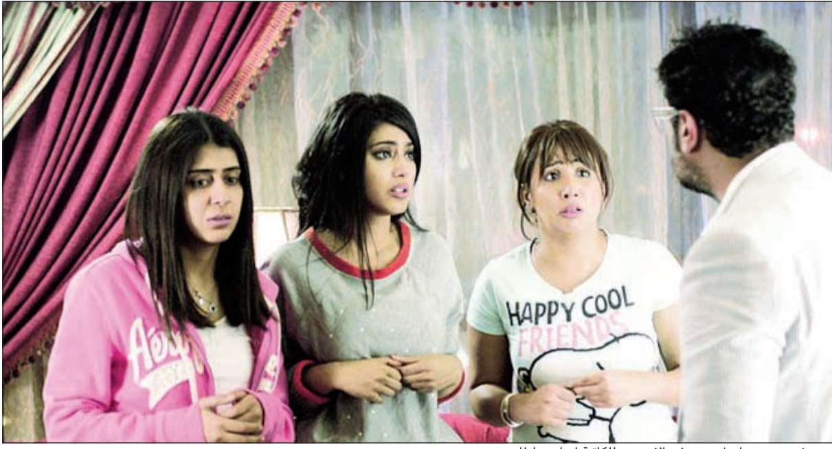
.. ومشهد من مسلسل «حب في الأربعين» للكاتبة إيمان سلطان