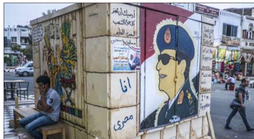
رسم لصورة المشير عبدالفتاح السيسي على جدار بأحد شوارع شرم الشيخ المصرية (أ. ف. ب)

باختياره، وذلك عن طريق الاجتماعات المحدودة والعامّة والحوارات، ونشر وتوزيع مواد الدعاية الانتخابية، ووضع الملصقات واللافتات واستخدام وسائل الإعلام المسموعة والمرئية والمطبوعة والإلكترونية، وغيرها من الأنشطة. وأشار شيل خلال مداخلة هاتفية مع أحد البرامج الحوارية المصرية إلى أن مخالفة قانون الانتخابات