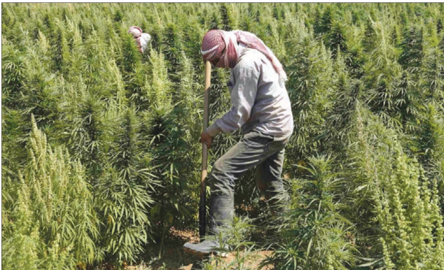
عمال في حقل لنبات القنب الذي يستخرج منها الحشيش في منطقة الهرمل في البقاع اللبناني.. وقد صنفت الأمم المتحدة لبنان بين أكبر 5 مصادر لزراعة الحشيش في العالم وفي الفترة الأخيرة بدأت الأصوات ترتفع لتشريع هذه الزراعة بعد أن سمحت دول أوروبية وأميركية باستخدامه