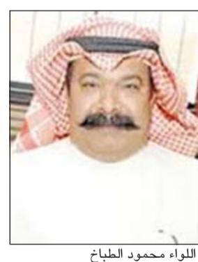
اللواء محمود الجلاهمة

تمكن رجال مباحث الأحمدى بقيادة العقيد وليد الدريعي من ضبط مسدس ربع وكمية من مادة الشبو المخدرة وكذلك 3 أقنعة بحوزة مواطن سيق أن دخل السجن المركزي لتورطه في قضايا متعلقة بالمواد المخدرة لـ 3 مرات وأمضى في السجن منذ عام 1992 حتى الآن نحو 15