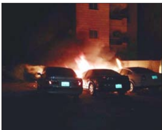
نيران الكيبل امتدت إلى أخشاب وأشعلت النيران في 3 مركبات

تسبب الحمل الكهربائي الزائد على كيبل للكهرباء تحت الأرض اندلعت النيران لوجود أخشاب ومهمات فوق الكيبل مكونة كرة ضخمة من اللهب لتمتد وتلتهم 3 مركبات كانت متوقفة بجانبها، هذا ما حصل فجر اليوم بمنطقة جلب الشيوخ فقد هرع رجال إطفاء مركز الجلب لمكان الحادث وقاموا بمكافحة الحريق وتأمين إحدى العمارات القريبة منه حتى إتمام إخماده دون وقوع أي إصابات بشرية.