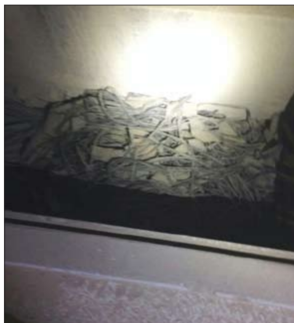
آثار السرقات المنهجة تظهر بجلاء داخل المحولات المسروقة