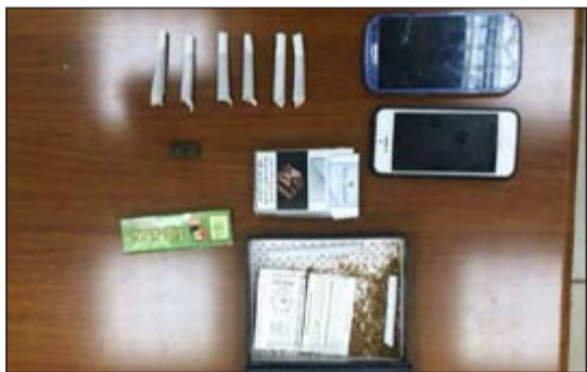
المضبوطات أحيلت الى «المكافحة»

أحبال رجال نجدة الأحمدى في ساعة متأخرة من يوم امس الى الإدارة العامة لمكافحة المخدرات سيدة تبين انها مطلوبة للتنفيذ بدين قدره 29 ألف دينار الى جانب مواطن، وذلك للتحقيق معها في قضية تتعلق بحيازة مواد مخدرة وتعاطي هذه المواد، وبحسب مصدر أمني فإن دورية النجدة وخلال جولة لها في منطقة المنقف اشتبتهت في مركبة يترنج قائدها، حيث طلب منه التوقف، وبعد مراوغة ومحاولة هروب توفقا اضطراريا، وتبين انه في حالة غير طبيعية وبرفقته سيدة تبدو هي الأخرى