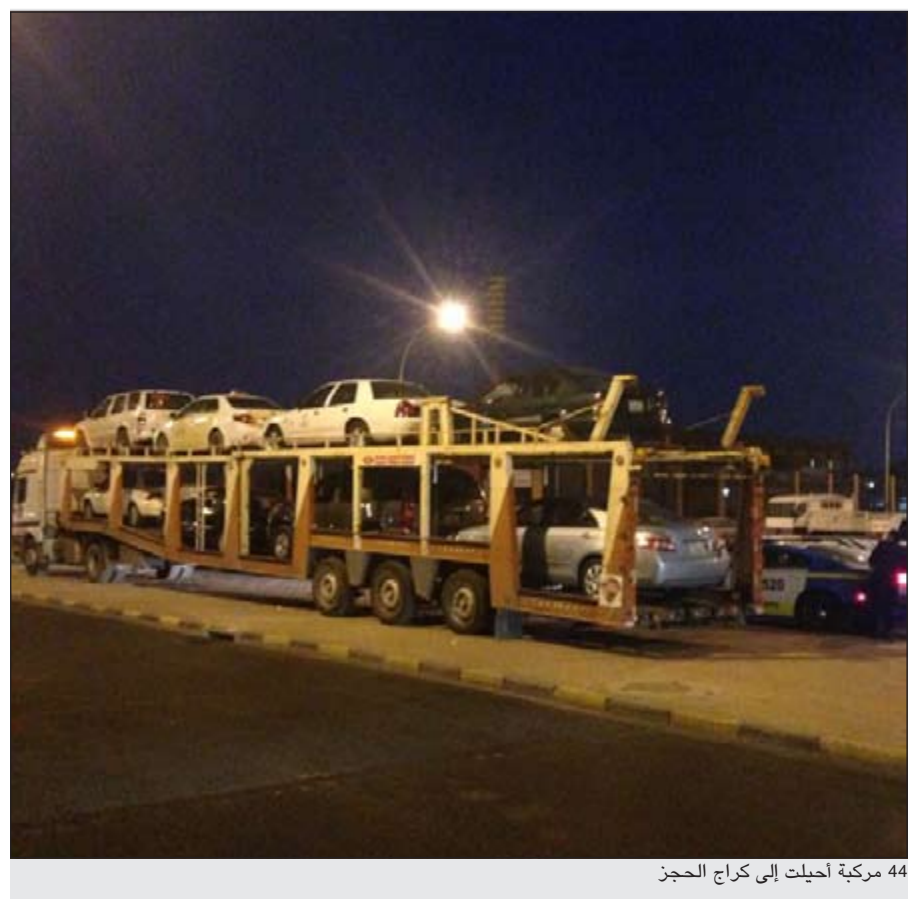
44 مركبة أحيلت إلى كراج الحجر

ادى حادث تصادم ظهر اليوم الى انقلاب مركبة واشتعال النيران بها على طريق الفحيحيل مقابل منطقة الشعب البحري، وتعامل مع الحادث رجال اطفاء مركز السالمية بقيادة الرائد يوسف القلاف حيث عمل رجال الإطفاء على اخماد الحريق وتأمين الموقع وتولى فنيو الطوارئ الطبية مهمة نقل المصاب قائد المركبة المحترقة للمستشفى الذي خرج منها بفضل العناية الإلهية قبل احتراقها.