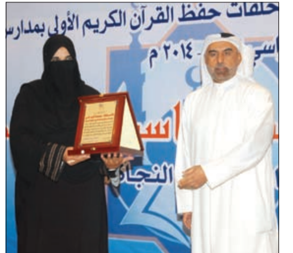
تكريم احدى المحفظات

والطلاب وابداعاتهم، كما تم عرض نماذج لقراءة الطلاب والطالبات وفقره ختمة القرآن الكريم وتم كذلك تكريم المنسقين والمنسقات والمحفظين والمحفظات.