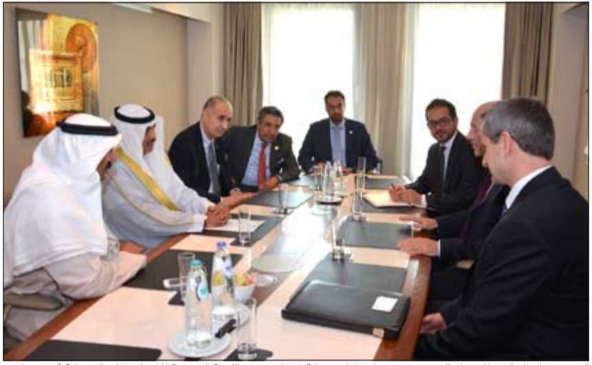
الشيخ صباح الخالد خلال مباحثاته مع عضو مجلس إدارة شركة (شل) ورئيس اللجنة التنفيذية للاستكشافات البترولية اندرو براون

عبر تقديم الخدمات الفنية التي تمتلكها الشركة. وأشار إلى ان مؤسسة البترول الكويتية وشركة