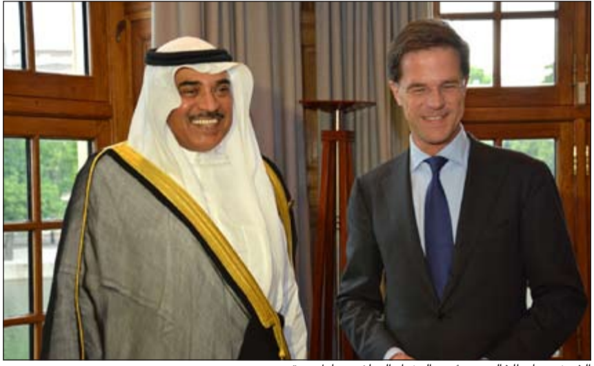
الشيخ صباح الخالد مع رئيس الوزراء الهولندي مارك روتي