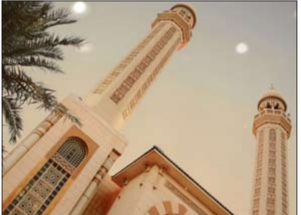
إحدى الصور المعروضة في المعرض