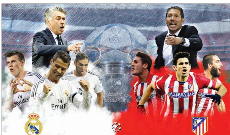
مواجهة صعبة بانتظار قطبي مدريد في النهائي

«الملك» يبحث عن العاشرة.. و«الأتلي» لدخول تاريخ «الأبطال»