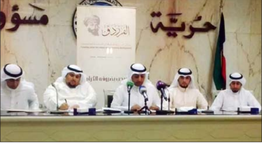
جانب من المؤتمر الصحافي لمركز الفرزدق للثقافة

معرفاً بالمركز والأهداف قائلا: مركز الفرزدق منظمة أهلية مستقلة غير ربحية تهدف إلى التنمية المجتمعية مع الجهات ذات العلاقة على المستويين المحلي والخارجي وترتكز على القضايا التي تبرز الوجه الحضاري والإنساني للكويت. كما انها تساهم في تعزيز مفهوم المواطنة الفاعلة وترسيخ مبادئ الروح الوطنية. كذلك تفعيل دور الثقافة بمختلف مجالاتها، والسعي إلى ترسيخ مبادئ حقوق الإنسان، والعمل على نشر الواسطة في خلال احترام جميع المعتقدات والاتجاهات الفكرية والسياسية، كما تعمل على تعزيز التعاون وفتح آفاق التواصل مع مؤسسات ومراكز ومنظمات المجتمع المدني محليا ودوليا.