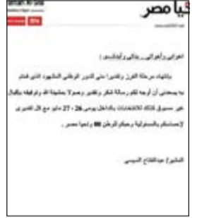
رسالة المشير عبدالفتاح السيسي

للإدلاء بأصواتهم حرصا على استكمال خارطة الطريق، وسعيًا إلى الاستقرار والتقدم. وعقدت الحملة مؤتمرا صحافيا بمشاركة أحمد الروبي والمحامية عصمت الخربوطلي واسماعيل السيد ومحمد الأشقر للإعلان عن نتائج انتخابات الجالية والتي أسفرت عن اكتساح كبير للمشير السيسي بعدد 62527 صوتا مقابل 2279 للمرشح حمدين صباحي. ووجهت الحملة شكرها إلى الكويت حكومة وشعبا،