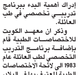
إدراك أهمية البدء ببرنامج تدريبي تخصصي في طب العائلة.

إدراك أهمية البدء ببرنامج تدريبي تخصصي في طب العائلة. وذكر ان معهد الكويت للأختصاصات الطبية قام بإضافة برنامج تدريب التخصصي لطب العائلة عام 1983 إلى لائحة الأختصاصات الطبية المعترف بها في البلاد، علما أن بداية البرنامج كانت بالتعاون مع «الكلية الملكية البريطانية» للممارسين العاميين كبرنامج تدريب مهني مدته 3 سنوات، وتم تعديده إلى 4 سنوات في العام 2001، ومن ثم إلى 5 سنوات في العام 2010، كما حاز البرنامج الاعتراف العالمي في العام 2005، حيث أصبحت الشهادة التي يحصل عليها المتدرب في حال اجتياز الامتحانات النهائية هي «الزمالة الملكية