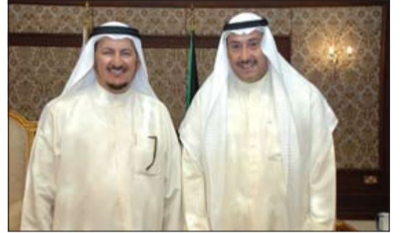
الشيخ فيصل الحمود ومبارك الدويلة

قدم اليه التهنئة. وقال الدويلة على هامش اللقاء ان أهالي محافظة الفروانية قد حالفهم الحظ باختيار الشيخ فيصل الحمود لقيادة هذه المحافظة، حيث انني قد تلست خلال لقائه اهتمامه اللا محدود بتطوير الخدمات المقدمة للمواطنين، متمنياً له التوفيق والسداد في عمله.