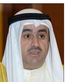
السفير صادق معرفي

أوضح سفيرنا لدى جمهورية النمسا و مندوب الكويت الدائم لدى الأمم المتحدة فيينا صادق معرفي رداً على سؤال لـ«كونا» حول ما أورده إحدى الصحف من تبرع الكويت لدعم أنشطة «وكالة إيران الذرية» بـ 250 ألف يورو أن التبرع الذي قدمته الكويت مؤخراً البالغ 250 ألف يورو هو لتغطية