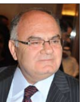
السفير د.خضر حلوي

قال السفير اللبناني د.خضر حلوي أمس وأن عيد المقاومة والتحرير يأتي متزامناً مع الاستحقاق الدستوري الأهم في لبنان، فإن اللبنانيين يتطلعون إلى ان تكون المناسبة فرصة لتحرير النفوس ومقاومة المتربصين ببيلدهم. واننا إذ نهني جميع اللبنانيين بهذه الذكرى الوطنية نتمنى ان يكون