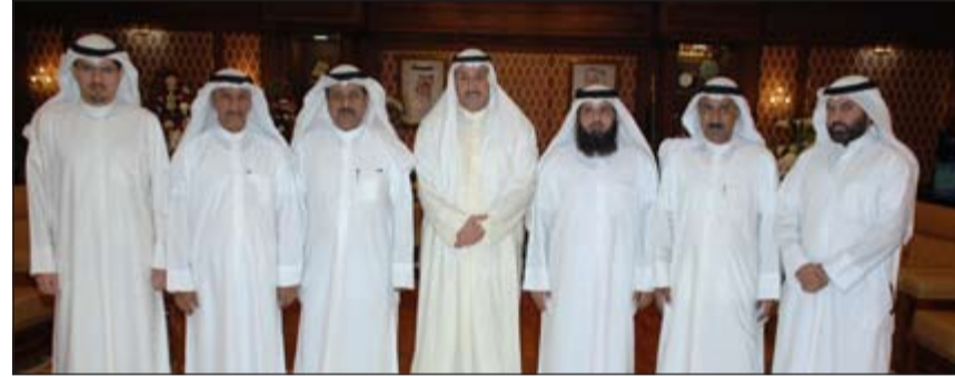
الشيخ فيصل الحمود مع رؤساء مجالس ادارات الجمعيات التعاونية بالفروانية