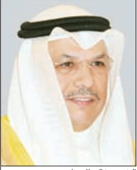
الشيخ خالد الجراح