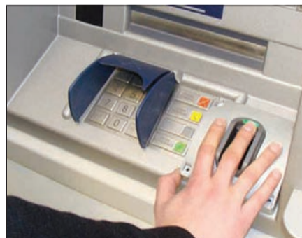
الإيهام والاصابع بدلا من الرقم السري

وكالات: بدأت شركة هيتاشي في التعاون من النظام المصرفي البولندي لتركيبة جهاز قراءة الإيهام في الصراف الآلي، على أن يطلق النظام الجديد العام الحالي على أكثر من 1,700 صراف آلي. فبعد ملاحظة نجاح تطبيق هذه التقنية الجديدة داخل مقرات البنوك البولندية، تقرر إتاحتها لآلات الصراف الآلي في الأماكن العامة، وليس هذا فقط بل حتى نقاط البيع التي تشبه «الكي نت» في المحلات بدأت بتطبيق ذات التقنية لعملاء البنوك بحيث تضع راحة يدك أو إيهامك على ماسح ضوئي خاص بعد أن تدخل بطاقتك المدنية.