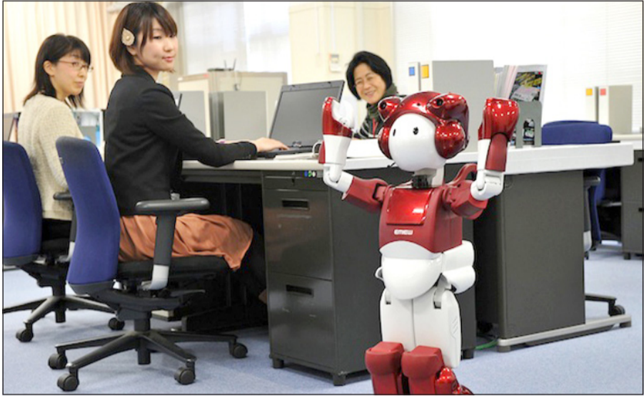
الروبوت المرشح يسير في زدهات مكاتب شركة هيتاشي

يعملون هنا.. وأقر هيتاشي إيكيدا المهندس لدى «هيتاشي» بان الحسن الفكاهي لهذا الرجل الآلي الصغير المختص باستمرار على شبكة الإنترنت ليس قويا حتى اللحظة، لكنه أشار إلى أن الأهم في هذا الرجل الآلي هو قدرته على الفهم. وحسب «هيتاشي»، فإن هذا الرجل الآلي لا يكفي بفهم الأسئلة والإجابة عنها بعد التعرف على الأصوات، لكنه قادر أيضا على تحليل رد فعل المتلقي عبر فهمه على سبيل المثال معنى تعبير الوجه وتحريك الرأس وخطوات أخرى. ولفت إيكيدا إلى أن «التكنولوجيا باتت تنتج للروبوت فهم ما يقصده البشر، حتى لو كان الأمر يقتصر على الحركات».