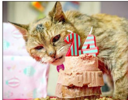
القطعة بوبي تحفل بعيد ميلادها الـ 24