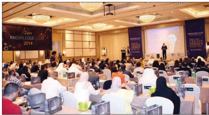
جمهور كبير تابع للقاء