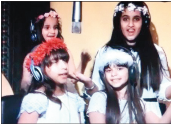
مشهد من كليب «الكويت عطاء ومحبة»