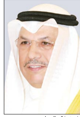
الشيخ خالد الجراح

غادر نائب رئيس مجلس الوزراء وزير الدفاع الشيخ خالد الجراح وبمعيته الوفد العسكري المرافق له، أرض الوطن في زيارة رسمية له إلى جمهورية الصين الشعبية الصديقة، وذلك ليترأس وفد الكويت لحضور القمة الرابعة لمؤتمر التفاعل وإجراءات بناء الثقة في آسيا (سيكا).