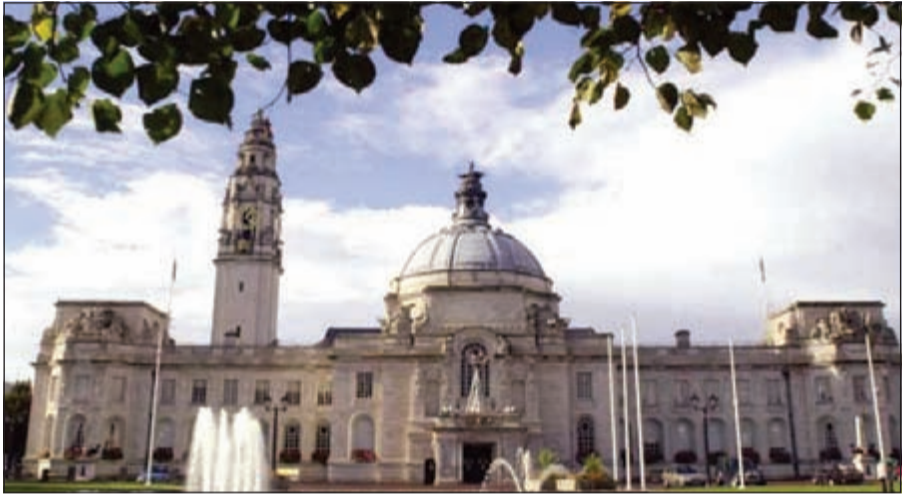
القاعة الكبرى بمبنى بلدية كارديف

بان البلدية قررت نقله إلى منزل عمدة المدينة. وأشارت كريستي إلى أنها وجهت مع خطيبها سمام ذلك دعوة للرئيس أوباما وزوجته ميشيل وفريق حمايتهما من الأمن السري لحضور حفل زفافهما في المكان الجديد، وتناول قطعة من كعكة العرس. وقالت الصحيفة إن سمام وخطيبته اضطرا للسحب بطاقات الدعوة لزفافهما، ويعكفان الآن على توجيه بطاقات دعوة جديدة للضيوف بعد تغيير مكانه.