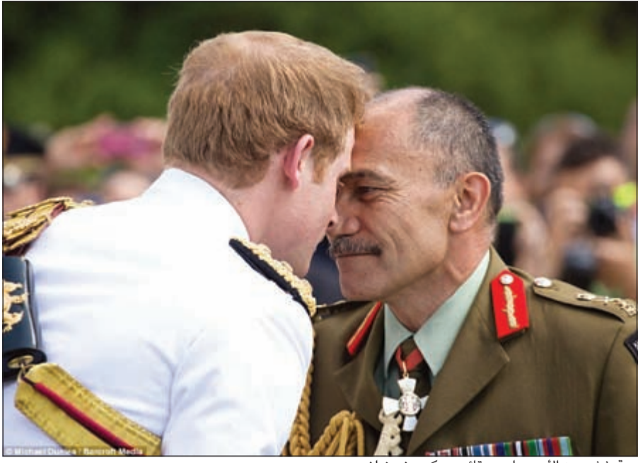
حبة خشم بين الأمير هاري وقائد عسكري نيوزيلندي

كاسينو - أ.ف.ب: حضر الأمير هاري في إيطاليا الأحد إحياء الذكرى السبعين لمعركة مونتي كاسينو (وسط) التي تواجها فيها القوات الألمانية مع قوات الحلفاء، والتي فتحت طريق سقوط روما بيد الحلفاء في الحرب العالمية الثانية. وحضر الأمير هاري بالزي العسكري البريطاني الحفل الذي جرت فيه من المحاربين، موجها معهم التحية إلى أرواح عشرات الآلاف من الجنود البريطانيين والنيوزيلنديين والبولنديين الذين قضاوا في تلك المعركة. وكان الأمير البالغ 29 عاما، وهو الرابع في ترتيب خلافة العرش البريطاني، وصل مساء السبت إلى إيطاليا أتيا من استونيا حيث التقى