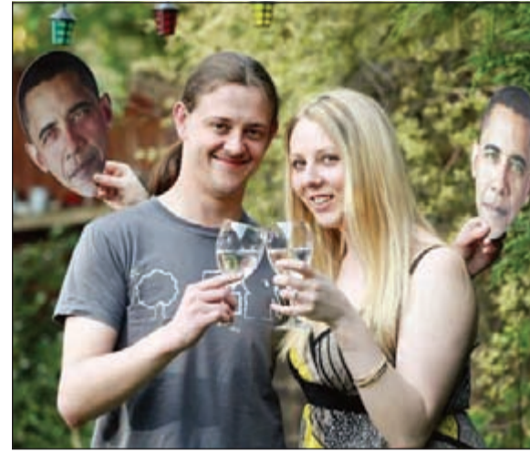
الخطيبان يحملان وجه أوباما كنوع من الاحتجاج على ما حصل

ارتياغا - أ.ف.ب: تنظر السلطات المكسيكية إلى تاجر المخدرات سيرفاندو غوميز الملقب بـ«لا توتا» على أنه من كبار المجرمين الخطرين في البلاد والمطلوب رقم واحد، أما سكان بلده في الغرب المكسيكي فينظرون إليه على أنه فاعل خير ومحسن كريم. ولا يذكر أحد بدقة متى كان آخر ظهور لهذا الرجل الذي يزعم كارتل المخدرات «فرسان الهيكل» في بلده ارتياغا، ذات الألفين وعشرين ألف نسمة، الواقعة في منطقة جبلية في ولاية ميتشواكان المضطربة، لكن منزله ما زال قائما فيها ولم يمسه سوء.