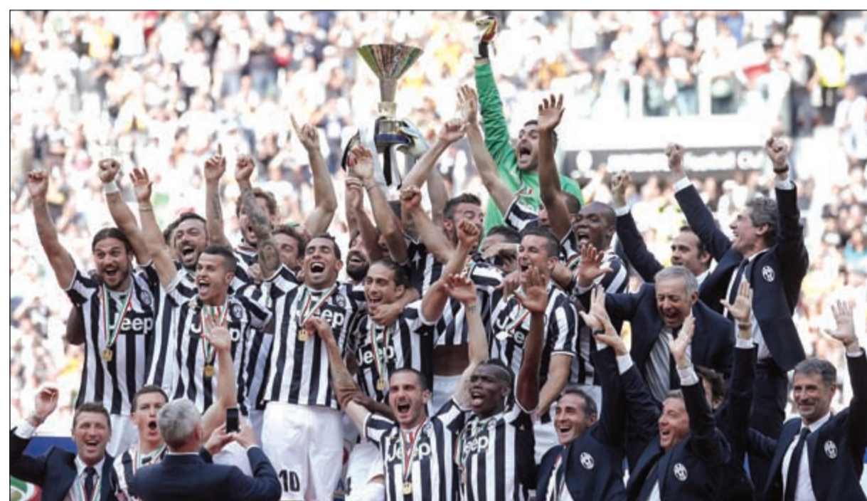
فرحة لاعبي «السيدة العجوز» بلقب الدوري

الولد ببيتيس إلى الدرجة الثانية رغم فوز الأول على الأخير 2-1، وبعد خسارته الثاني أمام ضيفه غرناطة