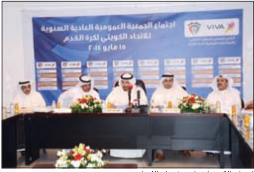
اتحاد الكرة اختار رؤساء اللجان