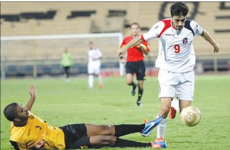
فريق شباب الكويت والقادسية في صراع جديد على اللقب

المباراة بالكثير من الإثارة والندية، حيث يسعى القادسية للجمع بين الكأس وبطولة الدوري، بينما يأمل الكويت خطف الكأس لتعويض فقدان لقب الدوري بعد أن حل وصيفاً للقادسية. وتردد أن المباراة قد يتم نقلها لتلفزيونياً نظراً لأهميتها ولشدة المنافسة بين الفريقين ولوجود عدد كبير من العناصر الواعدة في صفوفهما.