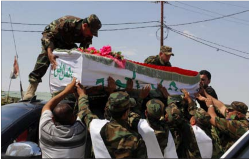
عراقيون يشيخون احد عناصر ميليشيا عصابات اهل الحق قتل اثناء القتال الى جانب النظام السوري