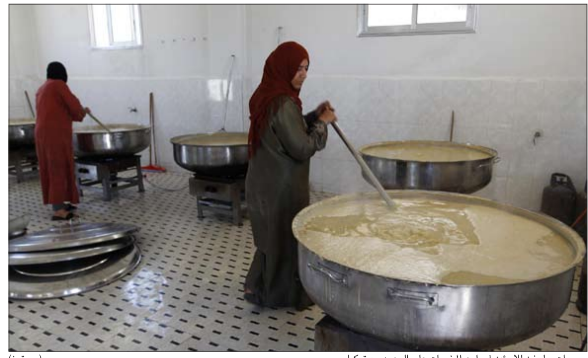
سوريات يطبخن للاجئين في أحد المخيمات على الحدود مع تركيا

اسفر عن مقتل ما لا يقل عن 14 من قوات النظام. وأضاف البيان ان الاشتباكات تراكمت مع قصف قوات النظام بصواريخ أرض - أرض على البلدة ومحيطها وسط تقدم قوات المعارضة وسيطرتهم على ساحة البلدية في البلدة. وفي محافظة حماة، قال المرصد في بيانه ان اشتباكات عنيفة تدور بين قوات النظام والكتائب المعارضة في محيط حواجز تل ملح والجملة وشليوط وشيزر والقراطة بريف حماة الغربي ما أدى الى سيطرة الكتائب المعارضة على حاجز تل ملح والجملة والمنطقة الواقعة على الطريق العام الذي يربط مدينة حمرة ببلدة السقيلية وسط انباء عن خسائر بشرية في صفوف الطرفين.