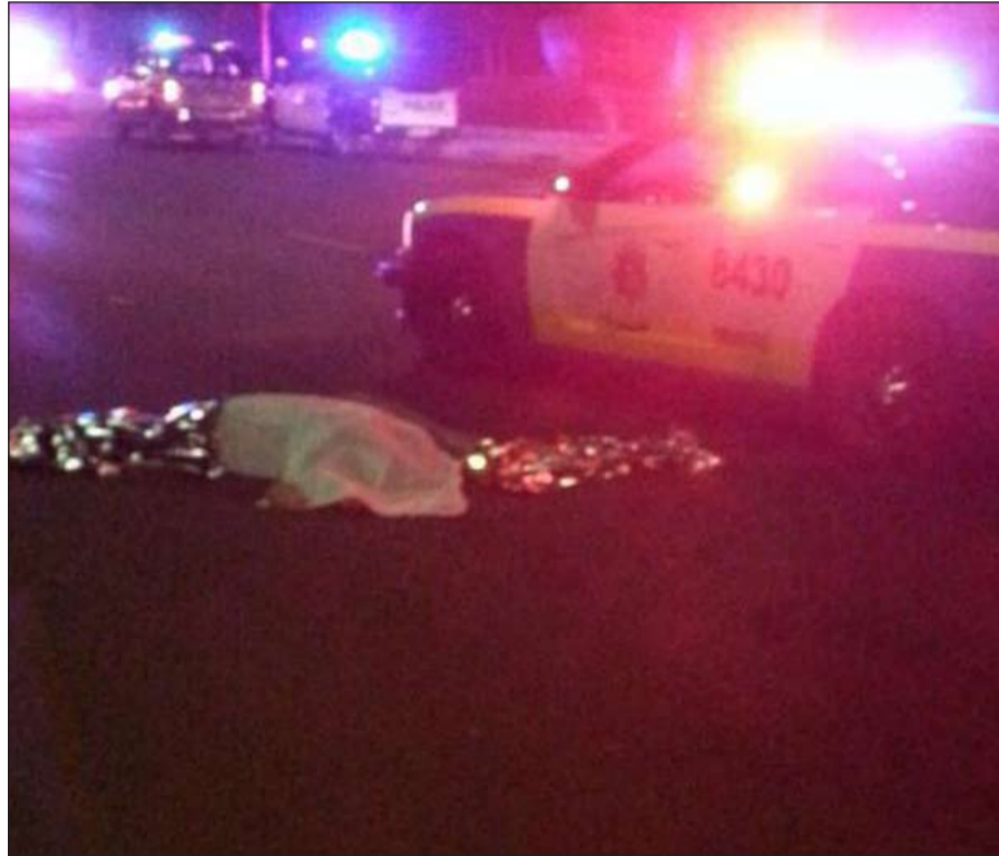
جثة الوافد المصري امام سفارة بلاده على الخليج