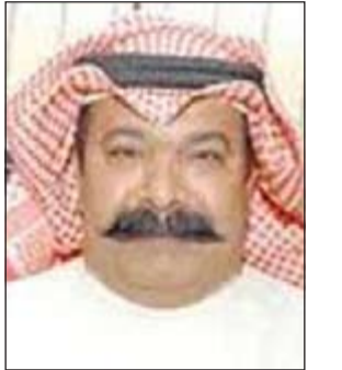
العميد عبدالحميد الطياح

وعليه، قام الدرعي بالإيعاز إلى مساعده المقدم سالم مرضي بتحديد إحدى ادارات المباحث للقيام بمهمة عمل المزيد من التحريات وتم الإستقرار على أن تناط مهمة الضبط إلى النقيب عبدالله التنيب. وبعد عمل التحريات تمت مداومة المنزل واعترف الشاب بسرقة المركبات في مناطق ابوخليفة والمنقف، وذكر أنه يختار المركبات موديل ما دون الـ 2000 حيث يكون من السهل تشغيلها تمهيدا لتفكيكها وبيع الأجزاء المهمة منها مثل الجير والمكينية على أن يبيع الهيكل بالكيلو.