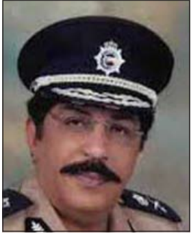
اللواء عبدالحميد العوضي

أبلغ مصدر أمني «الأنباء» أن وكيل وزارة الداخلية المساعد لشؤون الأمن الجنائي اللواء عبدالحميد العوضي، وقع أمس على قرار بإبعاد 15 وأقداً مصرية لتنظيمهم مسيرة مؤيدة لأحد مرشحي الرئاسة المصرية دون ترخيص.