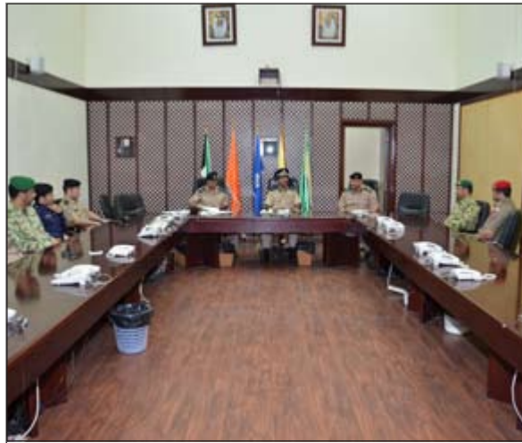
لواء اديب السويدان مترسا الاجتماع

اختتم في مقر القيادة التنسيقية لحماية الامن الداخلي تمرين اعداد الخطط الأمنية والذي شاركت فيه عناصر من الجيش الكويتي والشرطة والحرس الوطني بالإضافة الى الإدارة العامة للإطفاء. وأكد مدير عام القيادة التنسيقية لحماية الامن الداخلي اللواء اديب محمد السويدان أهمية ربط الوحدات الأمنية بعدة تمارين ميدانية ومكثبية خلال المواسم التدريبية، مشيرا الى التمارين السابقة «درع» والخاص بمكافحة الشغب، و«بيرق» للاقتحام وتعاون» للقتال في المناطق المبنية، وإدارة الأزمات والكوارث و«برق لمكافحة الأرباب»، مؤكدا دور واهمية القيادة التنسيقية لحماية الامن الداخلي باعتبارها الجهة المخولة بوزارة الداخلية والمسؤولة عن ربط القوات والتنسيق فيما بينها. وأوضح اللواء السويدان استمرارية التمارين والبرامج التدريبية المتخصصة بما يخدم رجال الامن كل في موقعه من أجل التعامل مع أي أحداث طارئة.