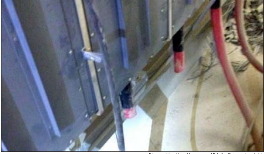
تلفيات شديدة ألحقها للصوص بالحوارات المستهدفة