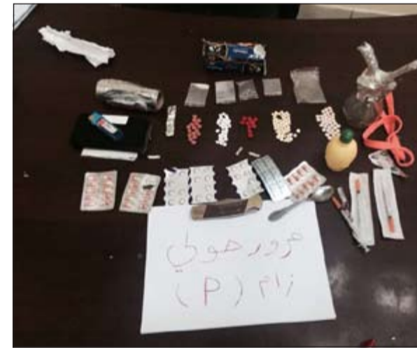
المخدرات وأدوات التعاطي في بيان