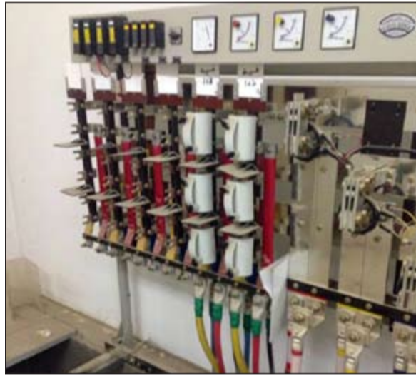
الخسائر ضخمة والحراسة مغيبة