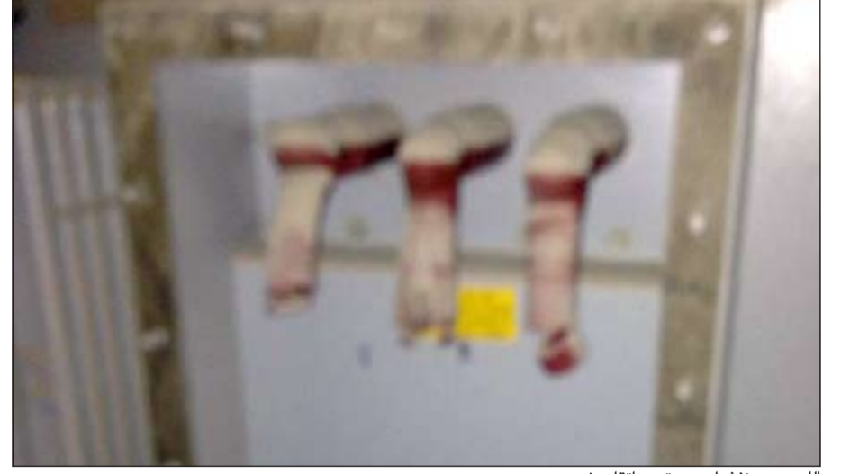
الصوص نفذوا جريمتهم بإتقان شديد

يجرون توصيلات مؤقتة قابلة لأن تصبح قنابل موقوتة