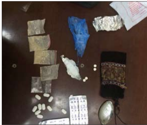
والحبوب والحشيش المضبوط مع المواطن والعراقي

الملازم أول الشويب ومرافقه عبدالفتاح وخلال جولة لهما في الحابرية اشتبهوا في مركبة متوقفة في ساحة ترابية، وتبين ان بداخلها مواطنا وعراقية وكانا متعاطين وعثر بحوزتهما على 4 أكياس بها هيروين و 40 حبة مخدرة، الدورية المرورية اختتمت عملها يوم أمس بقضية فالثة حينما اشتبهت في منطقة بيان بمركبته يابانية تبين ان قائدها مواطن، وكان في حالة غير طبيعية وبفتيشه احترازا عثر معه على 220 حبة كابتي و ظرفين احدهما هيروين والآخر شبو الى جانب سكين وأدوات تعاط.