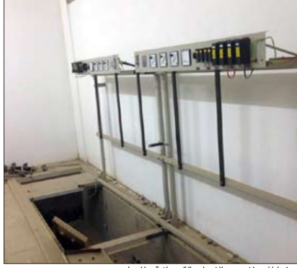
أفرغوا المحولات من الادوات الكهربائية والمعدات