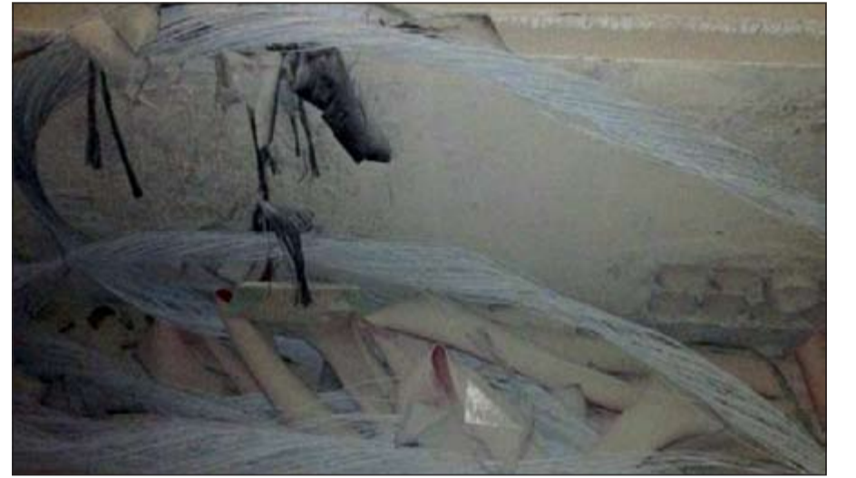
كيبيلات مبعثرة خلفها للصوص

بواقع 5 محولات، لافتا الى ان وزارة الكهرباء سجلت 13 قضية سرقة. هذا وانتقل الى المحولات التي استهدفها للصوص فريق من الادلة الجنائية لرفع البصمات.