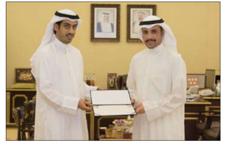
تكريم رئيس مجلس الأمة مرزوق الغانم