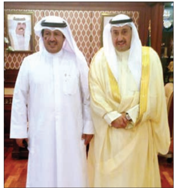
محافظ الفروانية الشيخ فيصل الحمود مستقبلاً النائب ماجد المطيري

قام محافظ الفروانية الشيخ فيصل الحمود بزيارة إلى نائب رئيس الحرس الوطني الشيخ مشعل الأحمد في مكتبه بمقر قيادة الحرس الوطني. من جهة أخرى استقبل الحمود في مكتبه بديوان عام المحافظة عضو مجلس الأمة النائب ماجد المطيري. وخلال اللقاء تبادل الطرفان الأحاديث الودية، وتطرقتا إلى احتياجات المرحلة المقبلة، وطرح الأفكار والمقترحات التي من شأنها تذليل العقبات وتقديم أفضل الخدمات في شتى المجالات عبر أسلوب عملي للمساهمة في تطوير المحافظة وتقديم أفضل الخدمات لأهلها