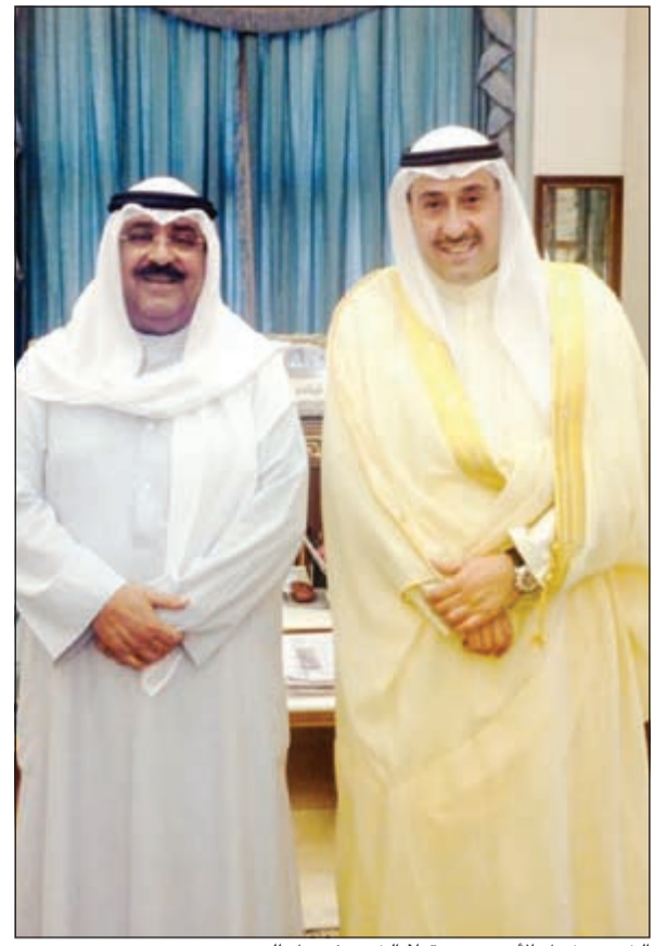
الشيخ مشعل الأحمد مستقبلاً الشيخ فيصل الحمود