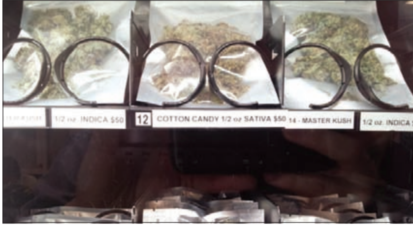
عبوات الحشيشة داخل آلة البيع