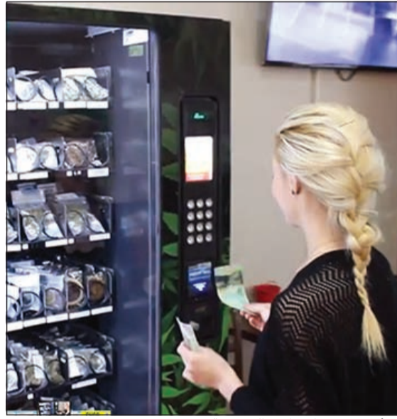
امرأة تشتري حاجتها من الحشيشة

في هذا البلد، فإن استخدامها لأسباب طبية مسموح منذ 1999، حتى أن قرارا قضائيا صدر مؤخرا أدى إلى ازدهار تجارة الحشيشة المستخدمة لغايات طبية. فتمتد الأول من أبريل، اضطر الأشخاص الذين يزرعون الحشيشة بمنزلهم في كندا والبالغ عددهم 30 ألفا، إلى وقف أنشطتهم وتم استبدالهم بشركات تجارية، أقل عددا لكنها تعمل بمواصفات صناعية أكبر، وهذا الحكم الجديد زاد من الضبابية التي تكتنف استهلاك الحشيشة في