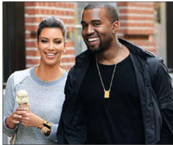
كيم كارديشيان وكانيي ويست

عشر، مقابل 20 ألف يورو لاستضافة حفل عشاء مع مصرف «جاي بي مورغان»، لم يساعد في تهدئة الغفوس الغاضبة على طريقة إحياء هذا الزفاف. وندد المرشح اليميني لرئاسة بلدية فلورنسا اشيلي توتارو بما اعتبره «بيعا بأسعار بخسة لمعالم فلورنسا»، فيما طالبت ميريام اماتو المرشحة عن «حركة خمس نجوم» المعارضة «باحترام أكبر لكونوا المدينة».