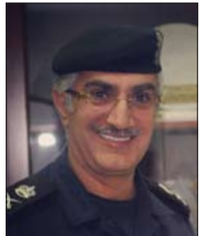
اللواء إبراهيم الطراح