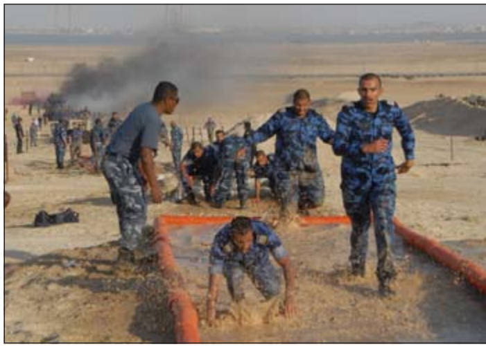
منتسبو الدورة عبروا 2 كيلومتر من الحواجز

نقل مواطن ووافد إلى المستشفى الأميري بعد إصابة الأول جراء اصطدام سيارته بونش الداخلية والثاني جراء دهسة بسيارة المواطن