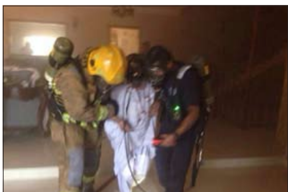
رجلا اطفاء يقومان بإخلاء المواطن المسن من موقع الحريق