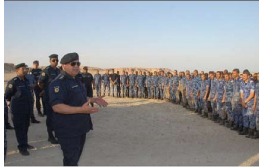
الفريق سليمان الفهد يخاطب منتسبي الدفعة بعد انتهاء التدريبات

وأكد على أن نائب رئيس مجلس الوزراء ووزير الداخلية ووزير الأوقاف بالإنيابة الشيخ محمد الخالد وكافة قيادات الوزارة يولون أهمية خاصة للتدريب العملي لرجل الأمن ووضع في ظروف مختلفة للوقوف على جاهزيته واستعداده الكامل للتعامل مع أية أحداث طارئة وفرض السيطرة الأمنية وتأمين سلامة المواطنين والمقيمين.. واثني الفريق سليمان الفهد على الجدية والحماس والحرص على استيعاب كل المهارات القتالية والمعلومات الأمنية من جانب الطلبة الضباط خلال البرنامج التدريبي.