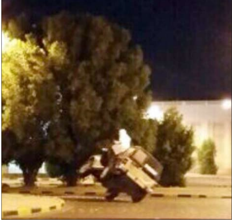
المستهد صاحب الرابعية الدفع يقودها على «تايرين» في دوار صباح الناصر

وقال مواطن، تحدث لـ «الأنباء» وقام بتصوير المستهد عدة صور: «كنت اجلس مع أحد الأصدقاء أمام أحد المنازل المطلّة على الدوار الداخلي لمنطقة صباح الناصر وفوجئنا بتوقف كل المسارات المؤدية إلى الدوار وتعطل حركة السير تماما، لكنكشف أن السبب قيام صاحب سيارة رباعية الدفع بقيادةها على تايرين والدوران بها بذلك الشكل المرعب حول الدوار ولمدة تجاوزت الـ 20 دقيقة». من جانبه، قال المصدر الأمني إنه سيتم ضبط المستهد قريبا جدا وسيتم إيداعه نظارة المرور وحجز سيارته وفق القوانين المرعية.