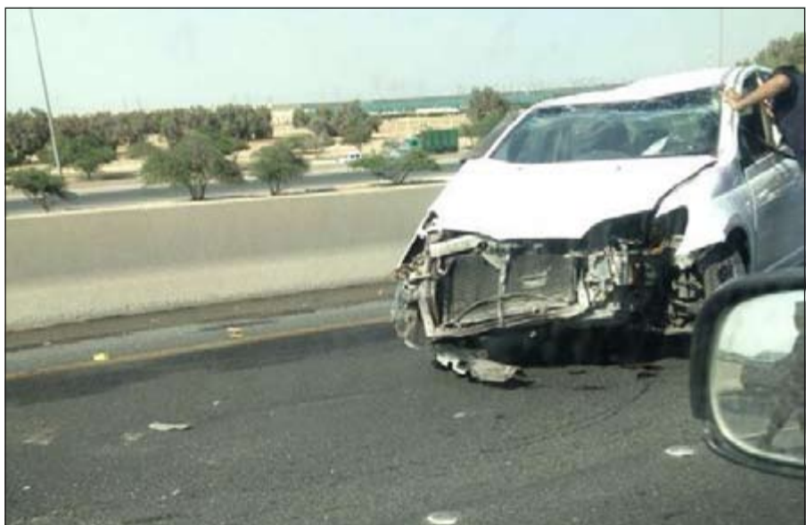
مقدمة المركبة وقد تحطمت تماما بعد اصطدامها بالدراجة النارية

تبين أن قائد الدراجة النارية لفظ أنفاسه الأخيرة متأثرا بالإصابات البليغة التي لحقت به وعليه تم نقل الجثة إلى الطب الشرعي. ومن جانب آخر شهد طريق الدائري الرابع التسريع حادث تصادم ثنائي تسبب بإغلاق جزء من الطريق حيث تم علاج سائقي المركبتين المتصادمتين ونقلهما عن طريق رجال الإسعاف، وأشار المصدر إلى أن حالة المصابين مستقرة.