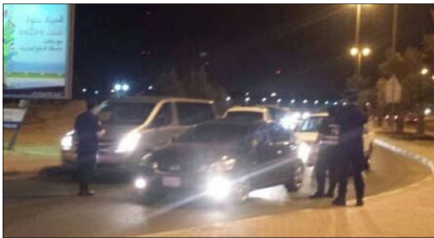
إحدى نقاط التفتيش على مدخل المنطقة