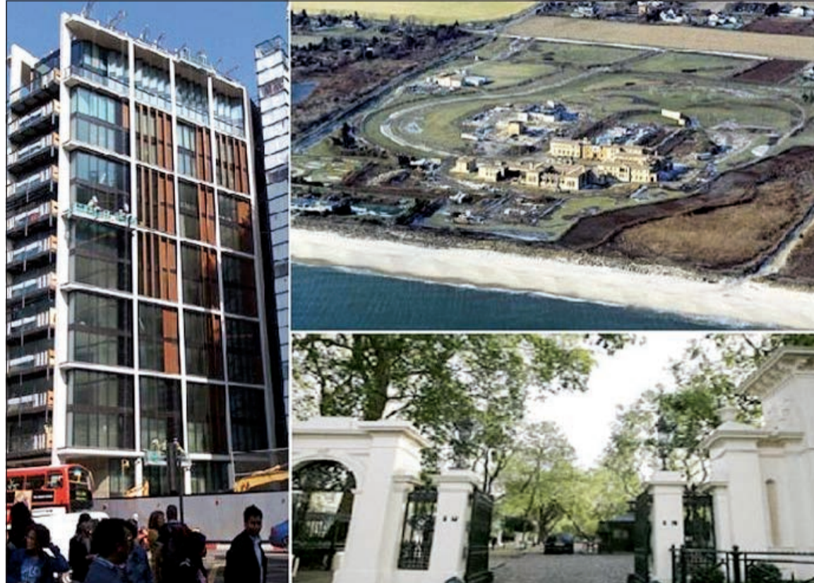
فوق: قصر الأمريكي آيرا رينيرت وتحتة فيلا لاكشمي ميتال بلندن وإلى اليسار عمارة «نايست بريدج» بلندن حيث الشقتان المختلتان المرتبتين الرابعة والسابعة باللائحة

أصبحت شبكة تويتر وسيلة لتبادل الانتقادات أو لنشر الأخبار الشخصية أو لوضع صور خاصة للأطعمة المفضلة، ولكن إمكانات الشبكة تفوق ذلك بكثير، فهي مثالية في الكشف عن أمور جديدة أو التعرف على الآخرين أو البقاء على علم بأحدث المجرىات. وكانت شبكة تويتر قد أضافت عدة خواص جديدة، ربما لم يتعرف عليها معظم مستخدميها، وهذا ما دفع موقع سي نت التقني للإشارة إليها بالتفصيل. 1- تزويد الحساب الشخصي بلزمة جمالية: أدخلت تويتر على إصدارها على الحواسيب تغييراً شاملاً جعلها أشبه بشبكة فيس بوك، فبالإضافة إلى إمكانية تغيير الصورة الشخصية لصاحب الحساب، أصبح أيضاً بإمكانه اختيار لون مختلف للكتابة على الصفحة. 2- إخراص التغريدات المزججة: أطلقت تويتر رسمياً قبل أيام قليلة ميزة حجب التغريدات الخاصة ببعض الأشخاص المزعجين على حساب المستخدم دون علمهم، وهو إجراء