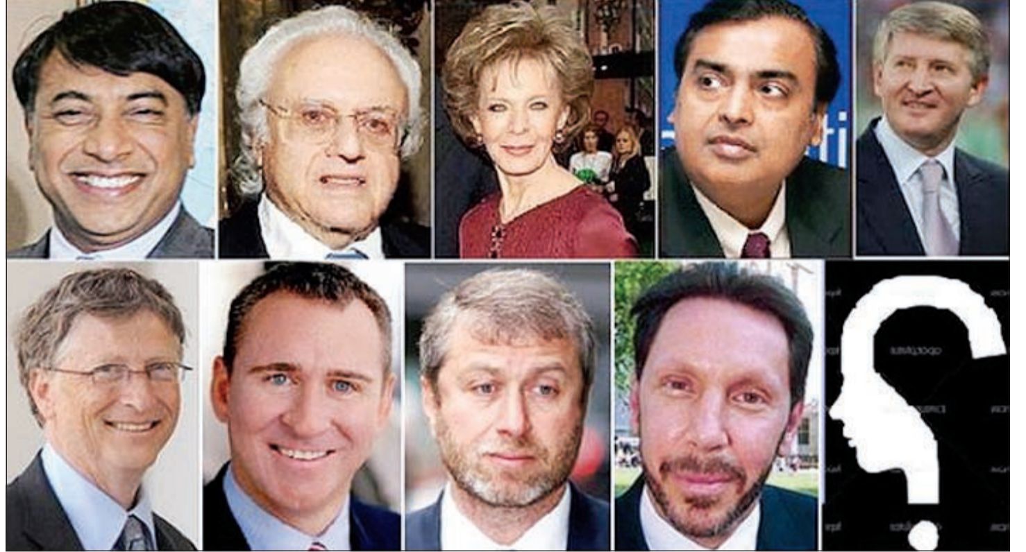
المليون لأعلى 10 منازل وما زال شاري شقة «نايست بريدج» مجهولاً

وهو الروسي رومان إيراموفيتش، اشتراها بمبلغ 140 مليوناً قبل 3 أعوام.