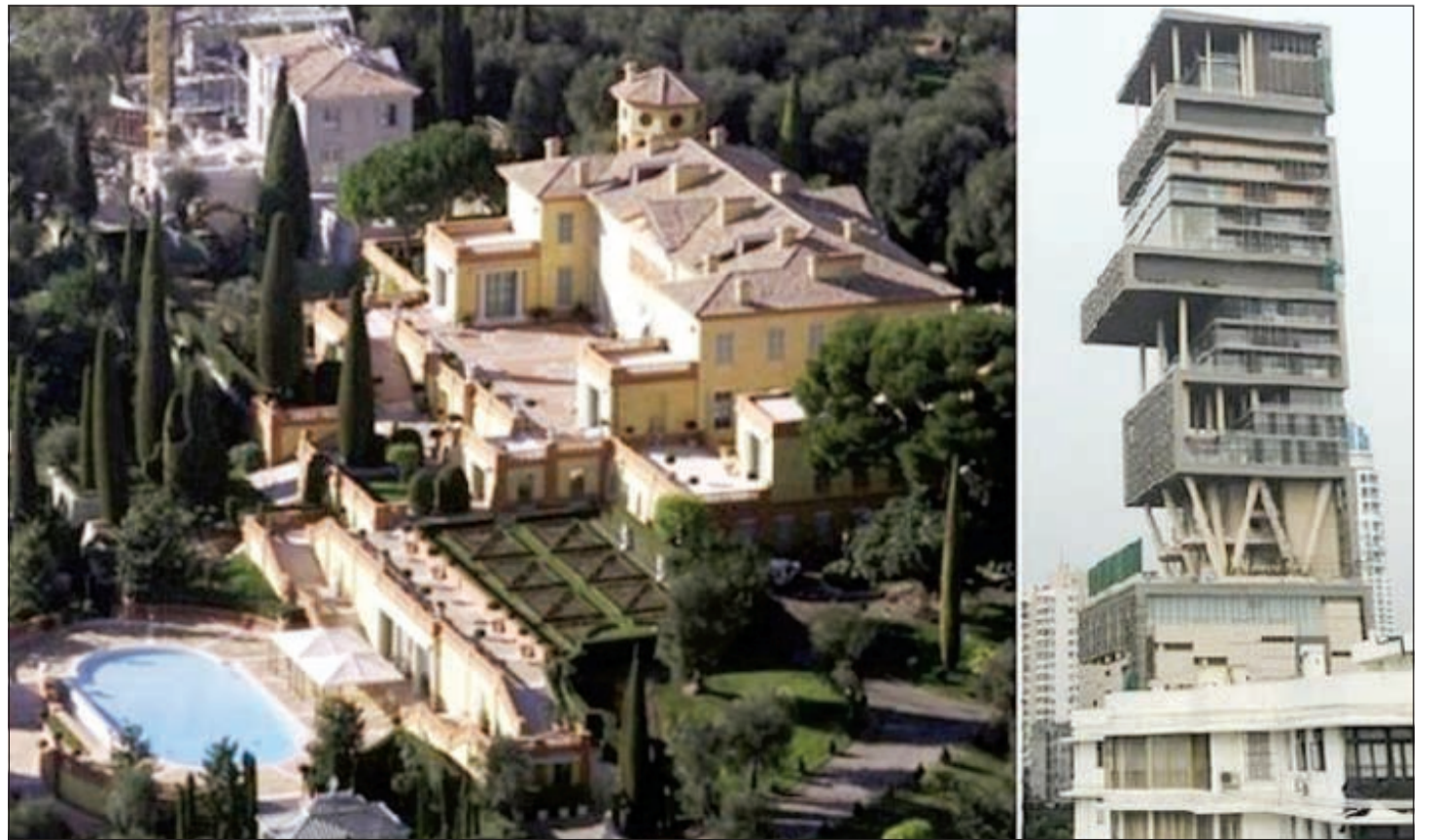
من اليمين: أغلى منزل بالعالم ثم فيلا «ليوبولدا» التي تملكها أرملة اللبناني الأصل أدمون صفراء منزل/عمارة باكثر من مليار