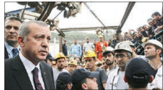
أردوغان في موقع الحادث

كما شهدت البلاد تظاهرات عنيفة احتجاجاً على إهمال سلامة العمال في قطاع المناجم، وطالب بعضها الحكومة بالاستقالة.