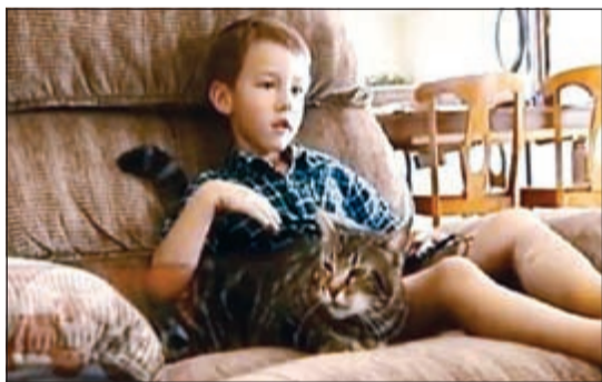
... ويحتضن قطته

إلى ذلك، أظهر التسجيل جروحا أصيب بها الطفل المصاب بدرجة طفيفة من التوحّد، والبالغ 4 أعوام، جراء الهجوم، في حين كتب