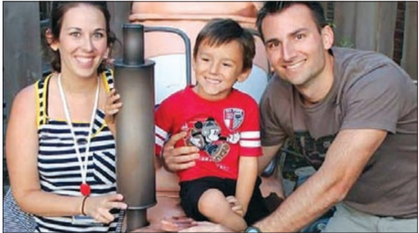
الطفل مع أبويه

فقد أعلن اتحاد نقابات الوظائف العامة في تركيا الذي يضم 240 ألف موظف على موقعه الإلكتروني إلى الإضراب العام، قائلًا إن «هؤلاء الذين يعضون بعمليات التخصص وسياسات تهدد أرواح العمال من أجل خفض الكلفة مسؤولون عن مجزرة سوما ويجب أن يحاسبوا». وتعم أجواء الغضب في تركيا مع تضاؤل الآمال بإمكان سحب عشرات العمال الذين لايزالون عالقين في المنجم في