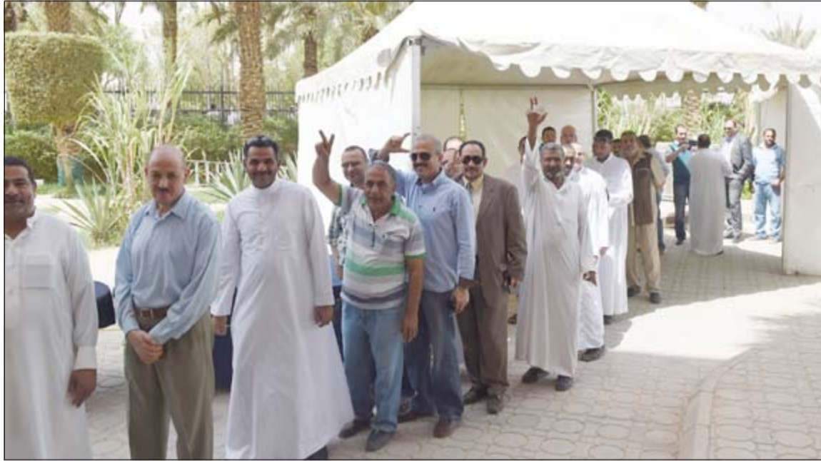
طابور من المصريين في العاصمة السعودية (الرياض) ينتظرون الإدلاء بأصواتهم في الانتخابات الرئاسية أمس

القاهرة - وكالات: شهد اليوم الأول من التصويت في الانتخابات الرئاسية المصرية الثانية بعد ثورة 25 يناير التي يتنافس فيها المشير عبدالفتاح السيسي وحمد بن صباحي إقبالا كثيفا من المصريين في الخارج ومن المقرر أن يستمر تصويتهم لأربعة أيام تنتهي الأحد. وأكدت غرفة عمليات وزارة الخارجية الخاصة بمتابعة تصويت المصريين في الخارج أن عملية التصويت في الانتخابات الرئاسية في الخارج سارت بشكل طبيعي وبدون أي معوقات في أول أيام التصويت.