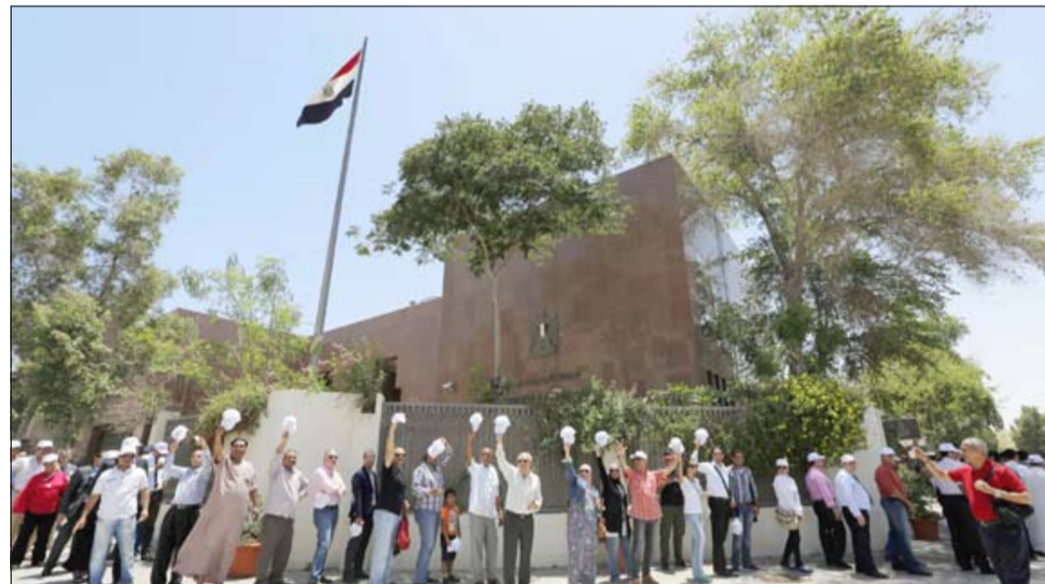
..آخرون يصطفون أمام القنصلية المصرية في دبي في انتظار التصويت

وأضاف المتحدث أن عملية الاقتراع سارت في جو هادئ وفي ظل نظام دقيق يعكس حرص المواطنين المصريين بالخارج على ممارسة حقوقهم الدستورية والمشاركة في انتخاب رئيس مصر المقبل، حيث تتابع وزارة الخارجية بالتنسيق مع لجنة الانتخابات الرئاسية سير عملية الاقتراع بالخارج وحل أي عقبات أو مشكلات قد تطرأ، كما تستمر الوزارة في توجيه السفارات والقنصليات لتقديم كل