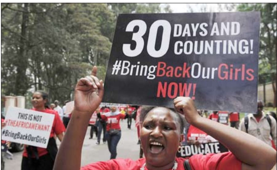
ناشطات مدافعات عن حقوق المرأة خلال تظاهرة داعمة للمختطفات النيجيريات في كينيا أمس

واشنطن - أ.ف.ب: أعلنت وزارة الدفاع الأميركية (البيتاغون) أن الجيش الأميركي يستخدم طائرات مراقبة من دون طيار إضافة إلى طائرات استطلاع في نيجيريا للمساعدة في عمليات البحث عن نحو 200 تلميذة خطفن قبل شهر بيد جماعة بوكو حرام. وأوضح مسؤول عسكري رفض كشف هويته لوكالة فرانس برس أمس أن الولايات المتحدة نشرت طائرات من دون طيار من طراز «غلوبال هوك» يمكنها التحليق على علو مرتفع، وطائرات من طراز «أم سي-12»، وهي طائرات للمراقبة تستخدم غالبا في أفغانستان. وأضاف «يمكنني التأكيد أننا نستخدم طائرات جمع معلومات ولاستطلاع والمراقبة من دون طيارين ومع طيارين في عمليات البحث عن